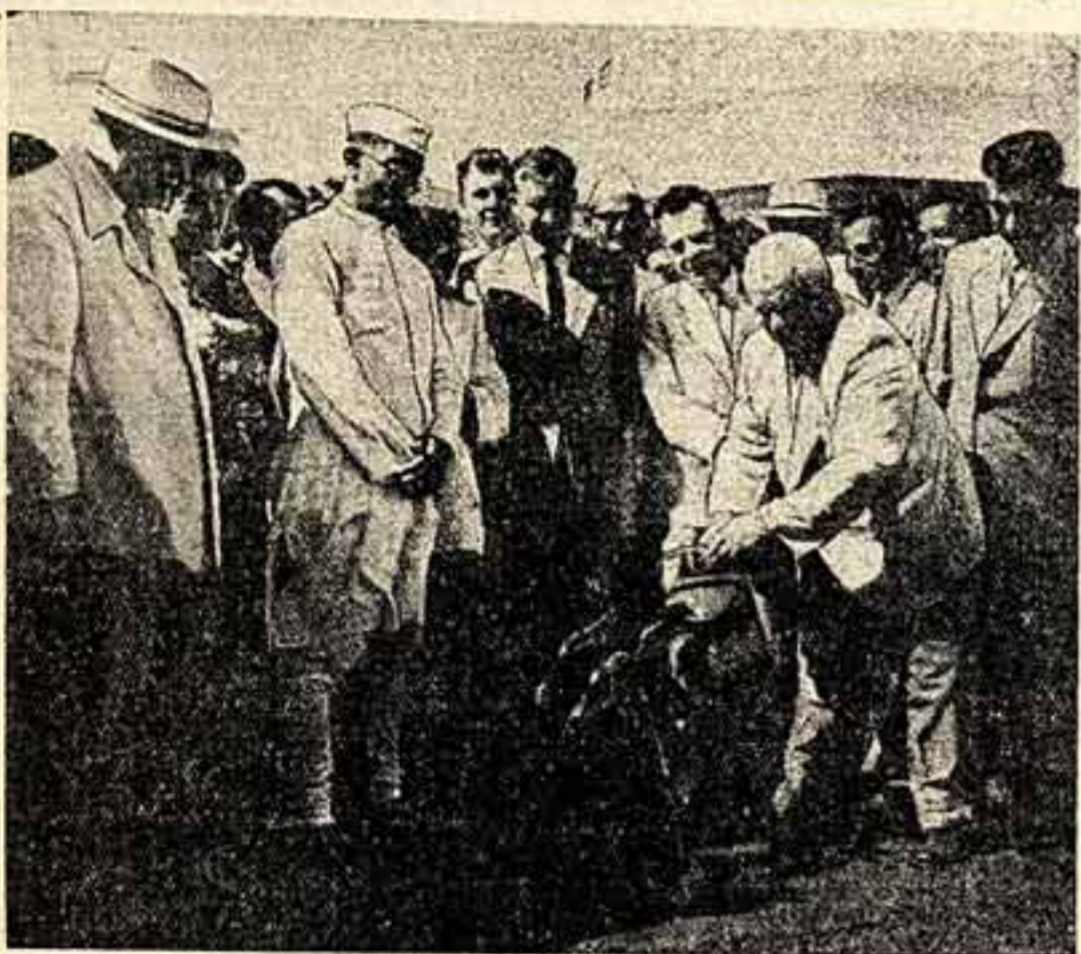
Н. А. Булганин и Н. С. Хрущев продолжают поездку по городам Индии. После пребывания в Мадрасе они 29 ноября прибыли в Калькутту. Жители города с торжественным приветием встретили делегацию Советского Союза. На улицы Калькутты, насчитывающей свыше пяти миллионов населения, встречать товарищей Н. А. Булганина и Н. С. Хрущева вышло не менее трех миллионов человек. Отсюда раздалась приветствия и адреса в честь Советского Союза и дружбы индийской дружбы.