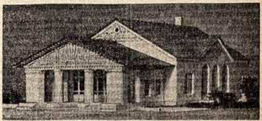
Проект сельского клуба со зрительным залом на 200 мест. Макет. Научно-исследовательский институт архитектуры общественных и промышленных сооружений Академии архитектуры СССР. Автор — действительный член Академии архитектуры Н. Я. Коалла.

Утвержден в качестве типового Министерством сельского хозяйства СССР