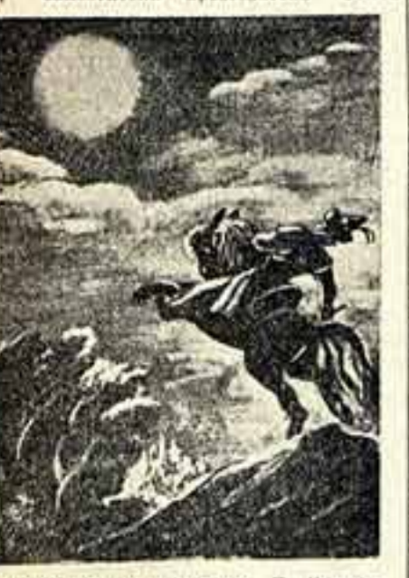
Иллюстрация к сказке П. Ершова «Конек-горбунчо». Художник Ян Марцин Шаниер.