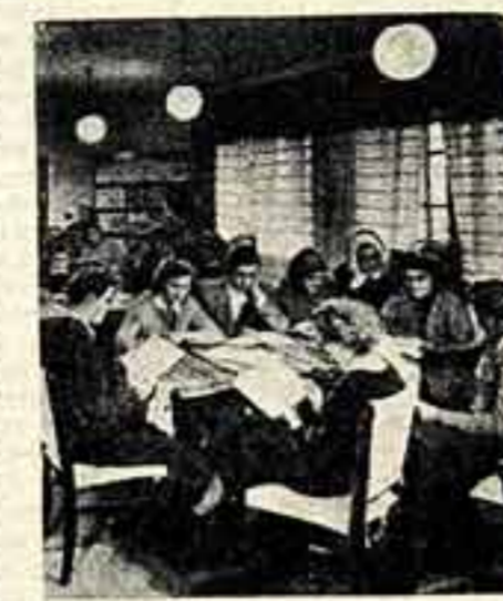
В читальном зале.

Центральный кружок сейчас готовится к постановке на сцене комедии известного венгерского писателя Кальмана Миксаша «Случай с Ностимладши и Марией Тот». Эту пьесу члены кружка намерены показать в нескольких деревнях и даже в главном городе комитета. Есть в доме культуры и кружки народного танца.