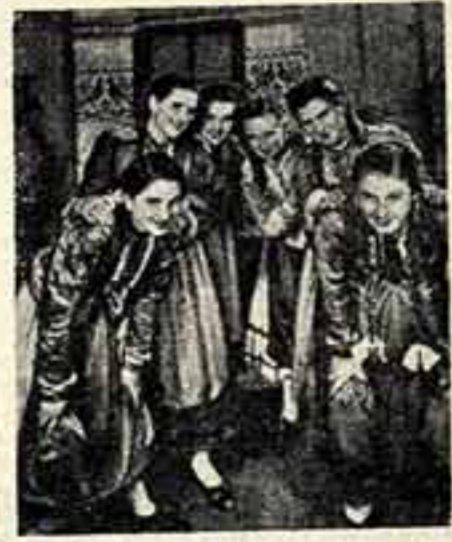
Участники кружка народного танца.