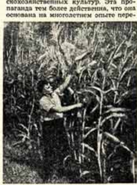
Южная гостя — кукуруза все шире продвигается на поля нечерноземной полосы. Посевная квадратно-гнездовой способ с применением органических и минеральных удобрений, она дает здесь отличные урожаи.

Картина в популярной форме показывает историю образования скудных подзолистых почв — наследия леса, разъясняет причины их низкого плодородия, главные из которых — высокая кислотность. Наряду с этим она широко пропагандирует передовые агрохимические приемы, позволяющие резко поднять плодородие и выращивать на этих землях высокие, устойчивые урожаи основных сель-