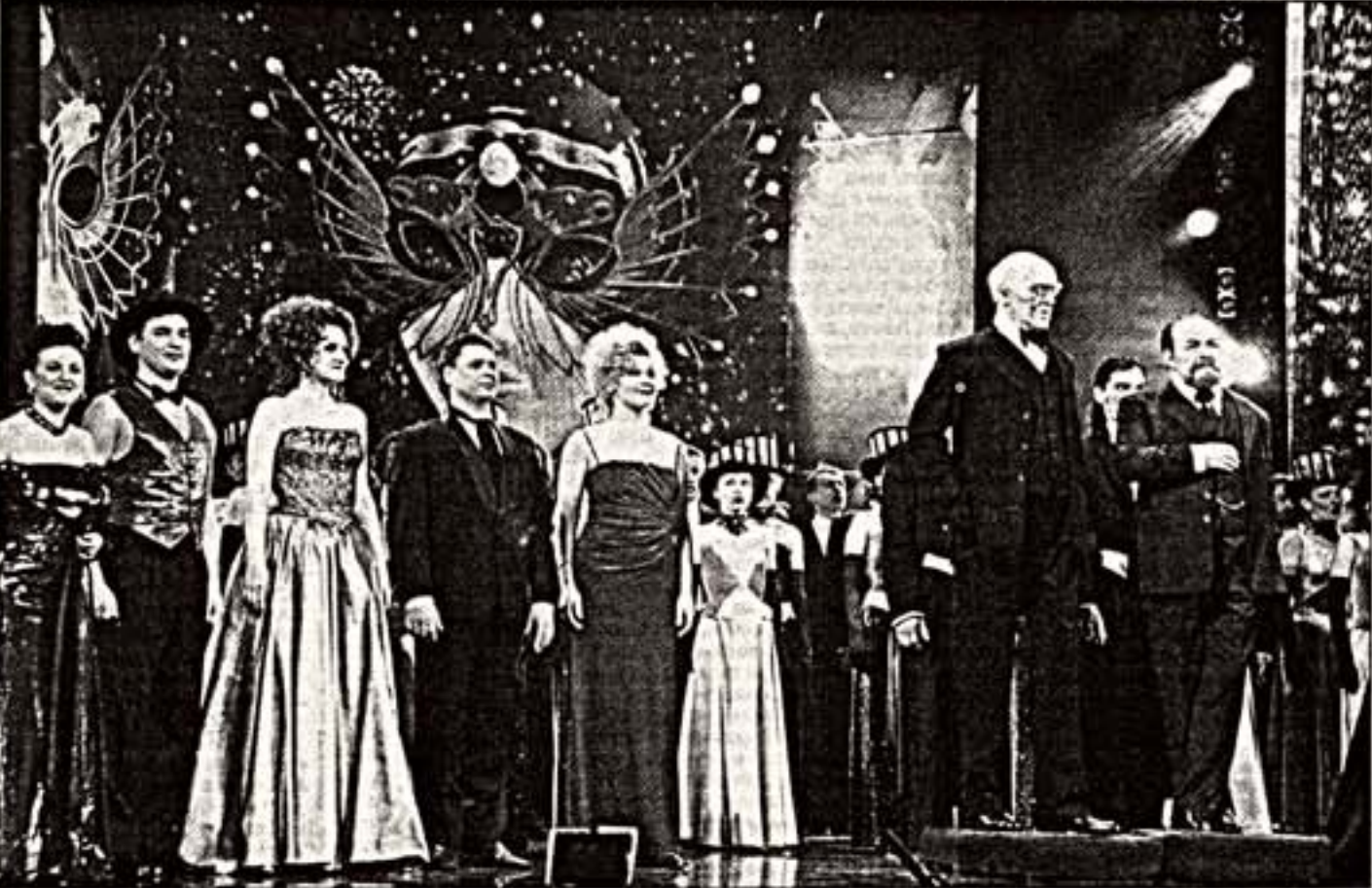
Фото на память со Сталинградским в Невропроче-Дачечко