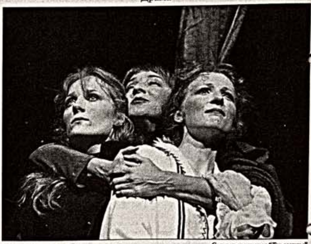
Сцена из спектакля “Три сестры”