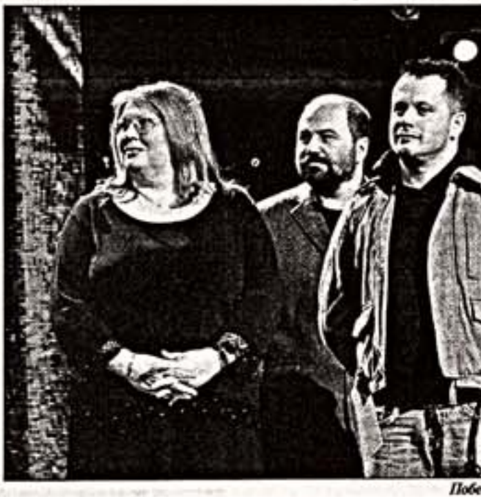
Победила команда “Тристана и Изольды”