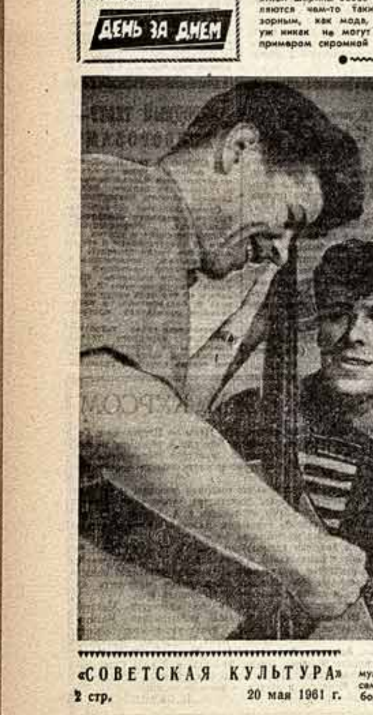
«СОВЕТСКАЯ КУЛЬТУРА» 2 стр. 20 мая 1961 г.

Видите, какая история! Человек готов купить импортные пальто, сделать из них модные пальто, но в то же время не понимает, что такое пальто.