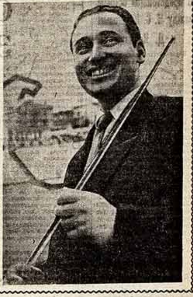
Текст и фото И. ВИЛЕНКИНА.