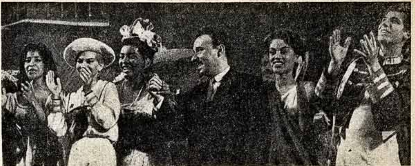
Артисты Кубы отвечают на приветствия зрителей. В центре — посол Кубинской Республики в СССР Фаура Чомон.