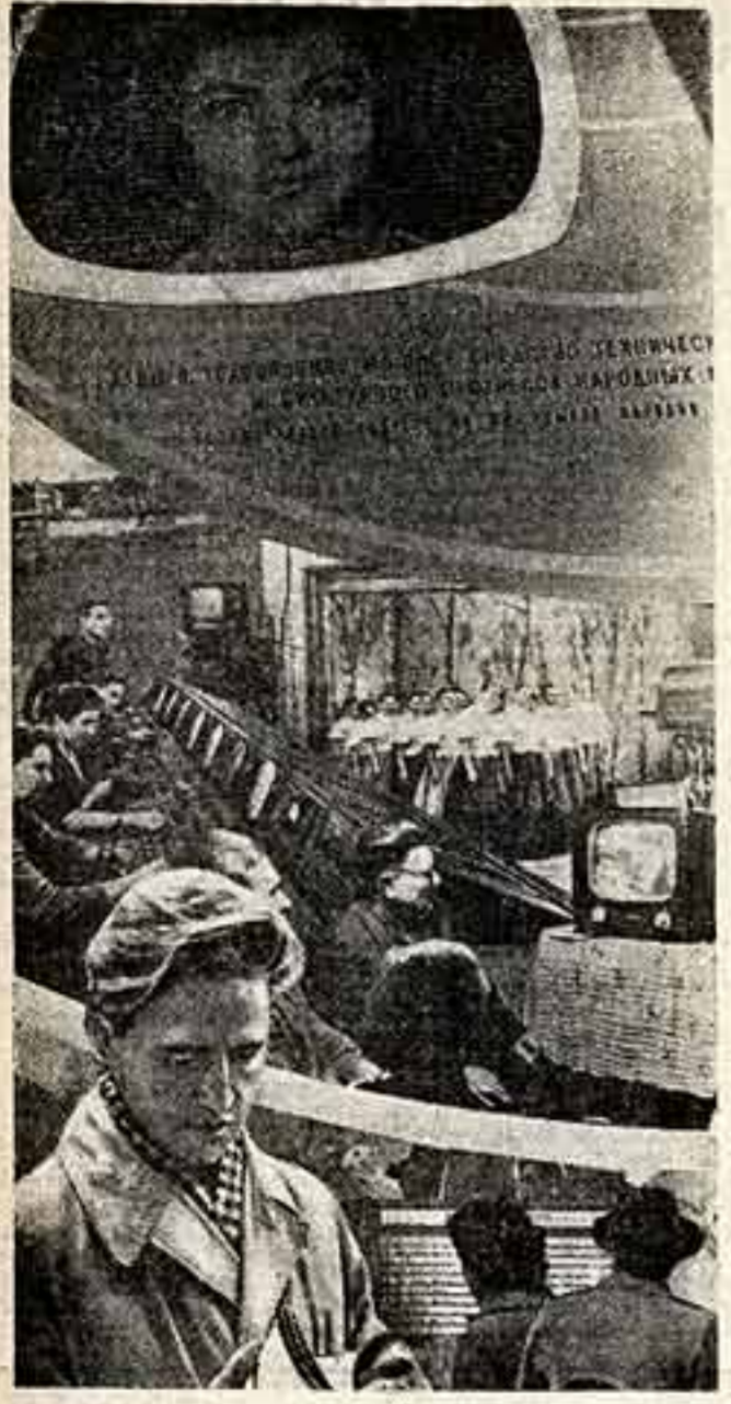
В павильоне «Культура и быт» РСФСР внимание посетителей привлекает стенд «Радио и телевидение», рассказывающий о бурном развитии радиотехники в нашей стране.