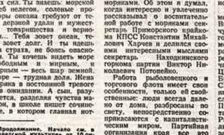
Продолжение. Начало см. в «Советской культуре» от 10 октября с. г.