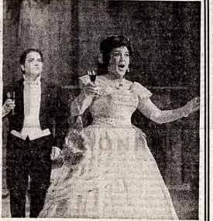
Анна Томова-Синтова в опере Верди «Травиата».