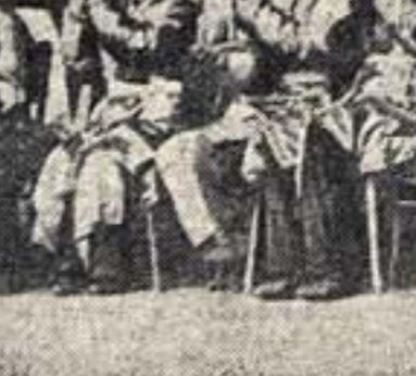
Ансамбль таджикского искусства, выступавший в Центральном парке культуры и отдыха им. Горького в Москве.

Привет нашим гостям — мастерам народного таджикского искусства!