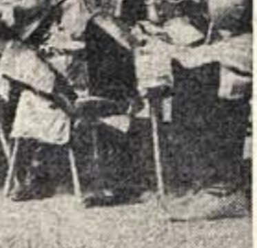
Ансамбль таджикского искусства, выступавший в Центральном парке культуры и отдыха им. Горького в Москве.