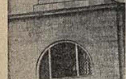
Капитан Волга — Москва. Медная модель каравеллы Колумба, установленная на башне шлюза № 3.