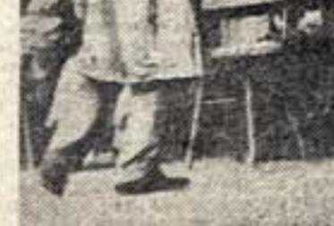
Ансамбль таджикского искусства, выступавший в Центральном парке культуры и отдыха им. Горького в Москве.

Привет нашим гостям — мастерам народного таджикского искусства!