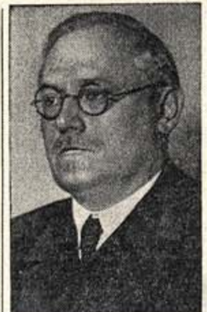
Прокурор Союза ССР тов. А. А. Вышинский.

За успешную работу по укреплению революционной законности и органов прокуратуры Центральный Исполнительный Комитет СССР награждает тов. А. А. Вышинского орденом Ленина.