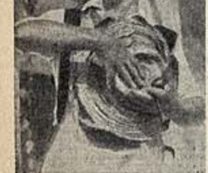
Мадр из фильма «Шахтер». Режиссер заслуж. деятель искусств С. Ютневич, Садовник — А. Матов.

Слушатели горячо приветствовали артиста, который составил программу своего концерта из вальсов и номеров русских и вальсовых композиторов, мало исполняемых в Ростове.