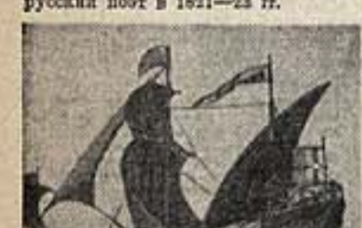
Капитан Волга — Москва. Медная модель каравеллы Колумба, установленная на башне шлюза № 3.

Музей, посвященный жизни и творчеству А. С. Пушкина, создается в селе Каменка, где пребывал великий русский поэт в 1821—23 гг.