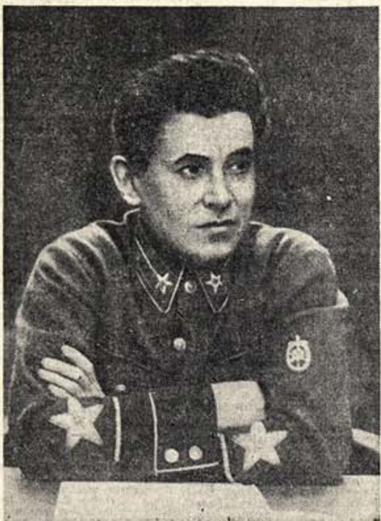
Народный комиссар внутренних дел Генеральный комиссар государственной безопасности тов. Н. И. Ежов.

Темным силам фашизма негодна же сложить с каждым днем растущий и кружащийся единый народный фронт, под знаменами которого выступают сейчас все, кому дорога история и культура и прогресс, свобода и счастье народов!