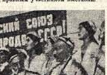
Ансамбль таджикского искусства, выступавший в Центральном парке культуры и отдыха им. Горького в Москве.

Решено не ограничивать число участников выставки только членами МОССХ. Великий художник, меланхолический работник на тематику выставки и представляющий картины, удовлетворяющие жюри по художественному качеству, может явиться полноправным участником выставки.