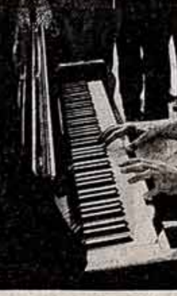
Во время встречи отдыхающих с композитором, лауреатом Государственной премии СССР Андреем Эшпаком.

Для хорошего отдыха и здоровья созданы все условия — на берегу Рузы прекрасная пляж, лодочная станция, имеется курзал на 600 мест, где проходит встречи с мастерами искусства, демонстрируются кинофильмы, проводятся тематические вечера.