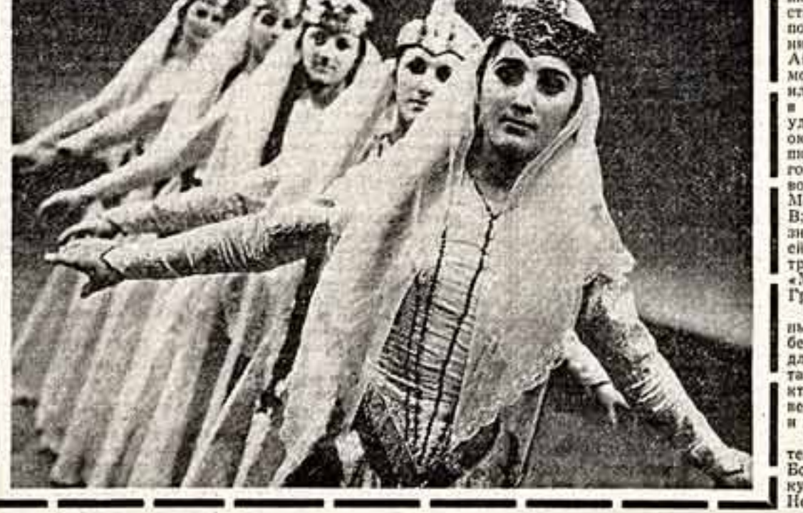
Самодельный ансамбль песни и танца из районного центра Терюла в Имеретин (Западная Грузия) популярен в республике. Его артисты — частые гости турнемины промышленных и сельхозпредприятий.