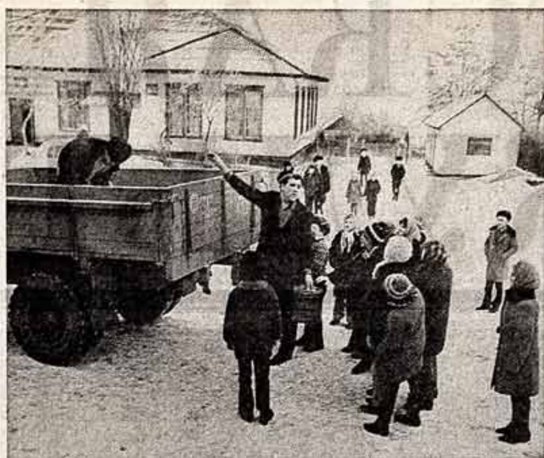
Его почти всегда окружают дети, подростки. С полными восторга и благоговения глазами любуются: а какой фильм будет идти на экране? Киножурналист Г. Сокур, а это к нему обращен вопрос ребят, помнит еще, как впервые в их Марговиновке Киноградской области «крутили» кино на елке магазина.