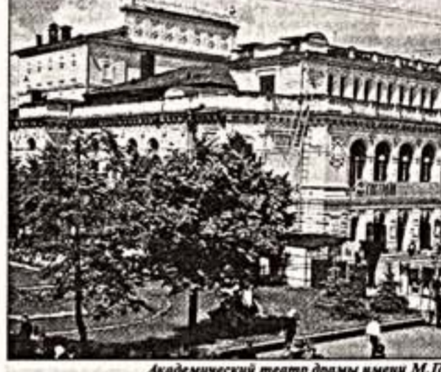
Академический театр драмы имени М. Горького