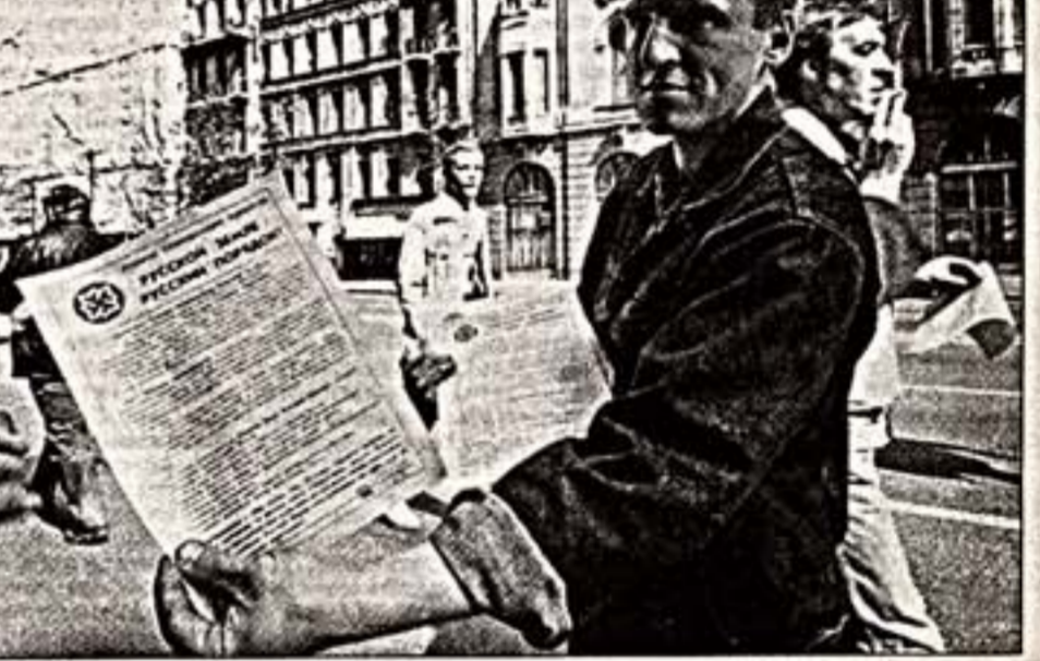
Гарри Бардин на "Культуре"