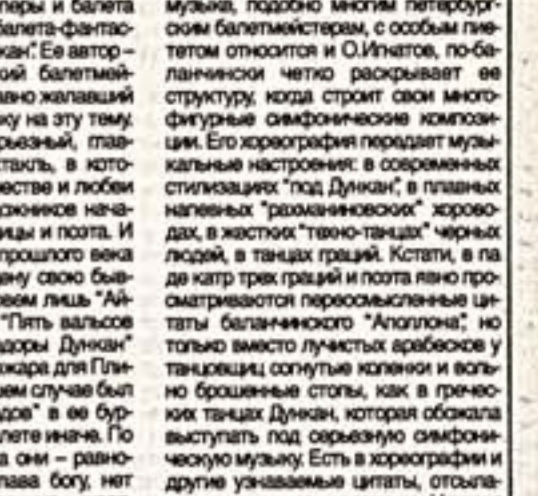
Именно по календарному принципу...