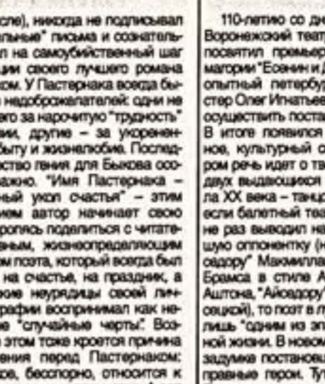
110-летию со дня рождения поэта...