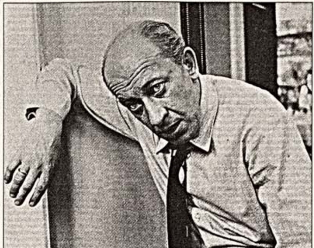
Е. Евстигнеев, 1974 г.

"Евгений Евстигнеев. Последние 24 часа" на "Первом"