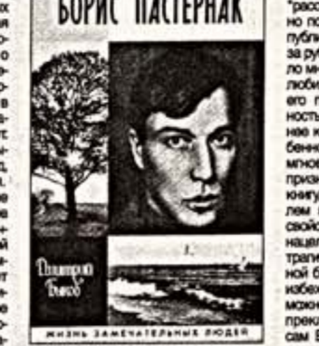
Именно по календарному принципу...