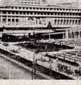
Здание Государственного ансамбля народного танца Молдавии «Юки».

Это соглашение определило принцип культурных связей между нашими двумя братскими странами на основе марксистско-ленинских положений о взаимном обогащении национальных культур, уважении друг друга, сотрудничестве и прогрессом интернационализма. Практически нет ни одной области культуры, где не осуществляется сотрудничество между СССР и КНДР. Хорошей традицией стал обмен художественными коллективами наших стран. За последние годы в КНДР побывали ансамбли песни и пляски Советской Армии имени А. В. Александрова, Украинский народный хор имени Г. Вервечи, хореографический ансамбль «Бережак», артисты из Грузии, Узбекистана, Бурятии... С большим успехом в Корею проходили гастроли Государственного ансамбля народного танца Молдавии «Юки».