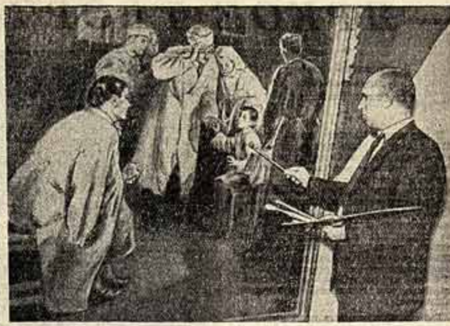
Наша кипучая многогранная жизнь дает советским художникам богатый творческий материал. На снимке известный художник Илья Глазунов работает над картиной «Видят, поспешной благодарности труд советских врачей».

человека. Побра- жаясь горой нау- чными, «спаряд- ный», оторванный от жизни.