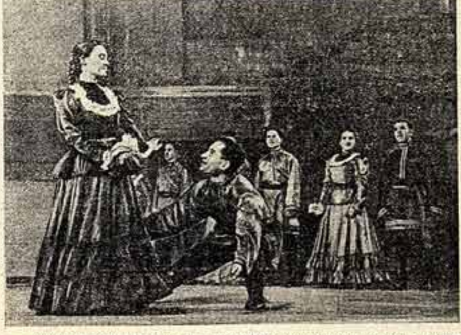
Уральский танец «Сударушка» в исполнении танцевального коллектива Дворца культуры Магнитогорского металлургического комбината.