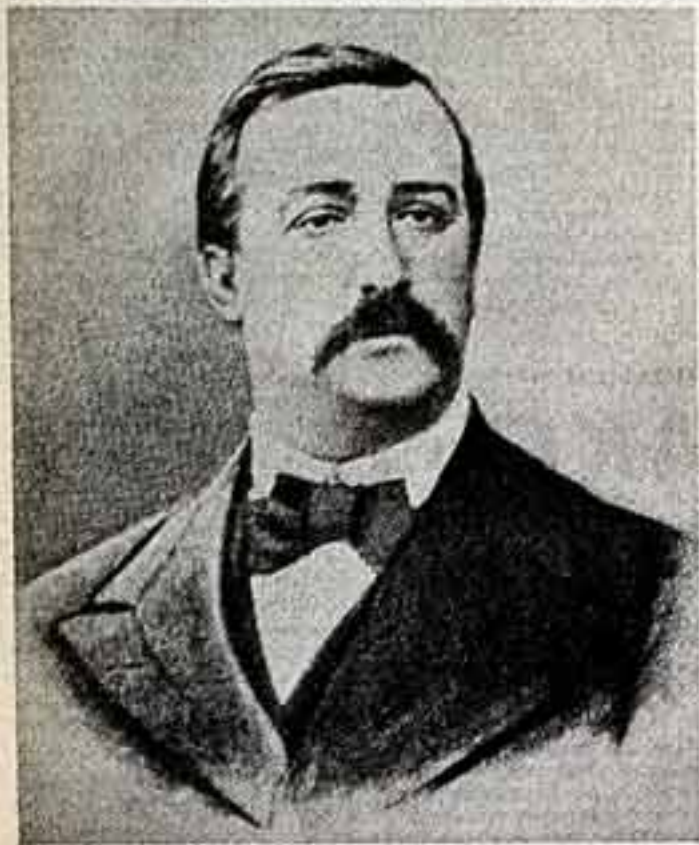
Сегодня музыкальная общественность столицы отмечает 150-летие со дня рождения выдающегося представителя Отечественной музыкальной культуры А. П. Бородина...