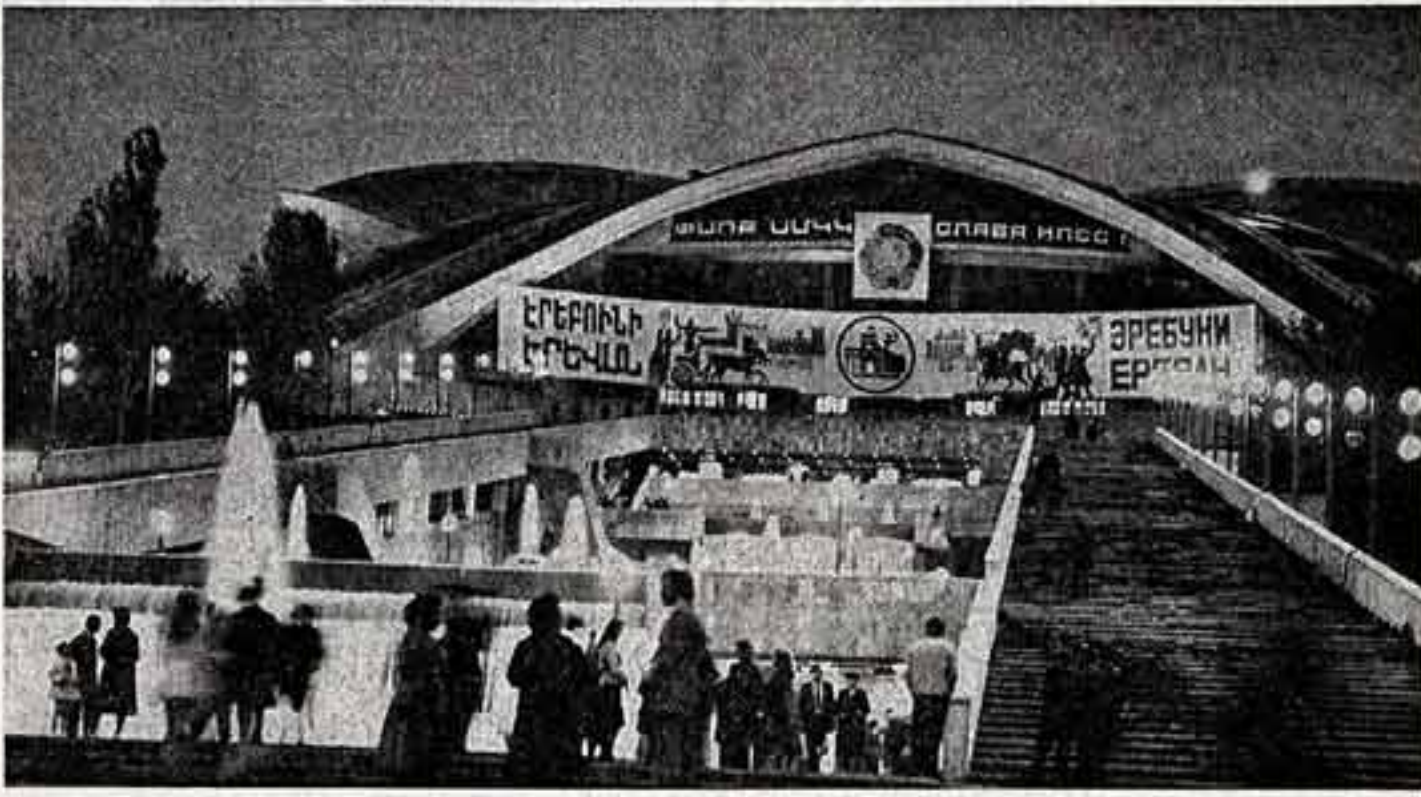
● Большой подарок для жителей Армении стал новый спортивно-концертный комплекс в Ереване. Оригинальной конструкции, украшенная каскадом фонтанов снаружи, богатым своим внутренним убранством перекладывает тысячи зрителей и различные художественные коллективы.

Н. МИХЕЕВ, народный артист РСФСР, артист Куйбышевского академического театра драмы им. М. Горького. КУЙБЫШЕВ.