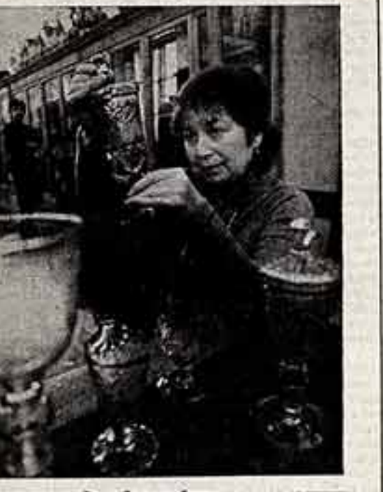
Евгений Абрамович Баратынский и родился здесь, в фамильном усадьбе, в 1800 году. Провел

«Прелесть и чудо», — писал о творчестве Е. А. Баратынского Пушкин. И верится: будет на родине выдающегося поэта музей его имени.