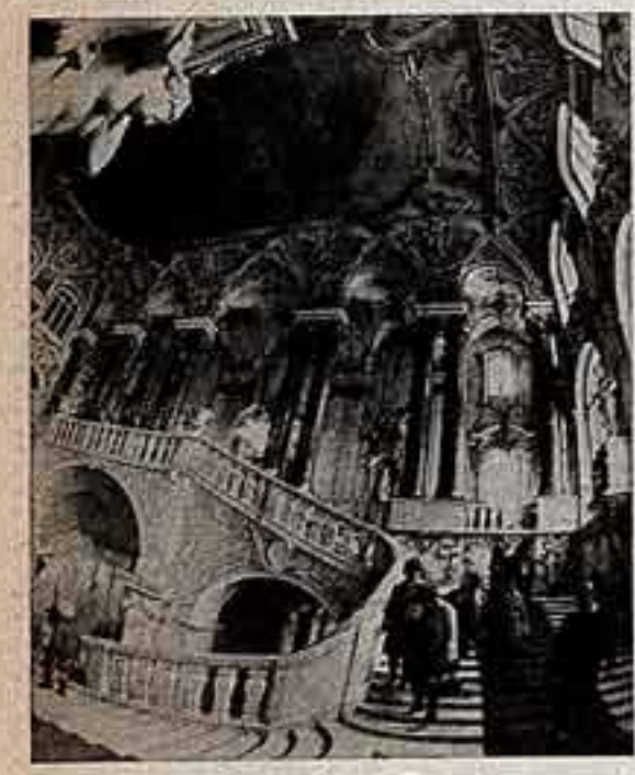
Ленинградский Эрмитаж. Познавать великие творения эпохи идут рабочие и колхозники, студенты и ученые...