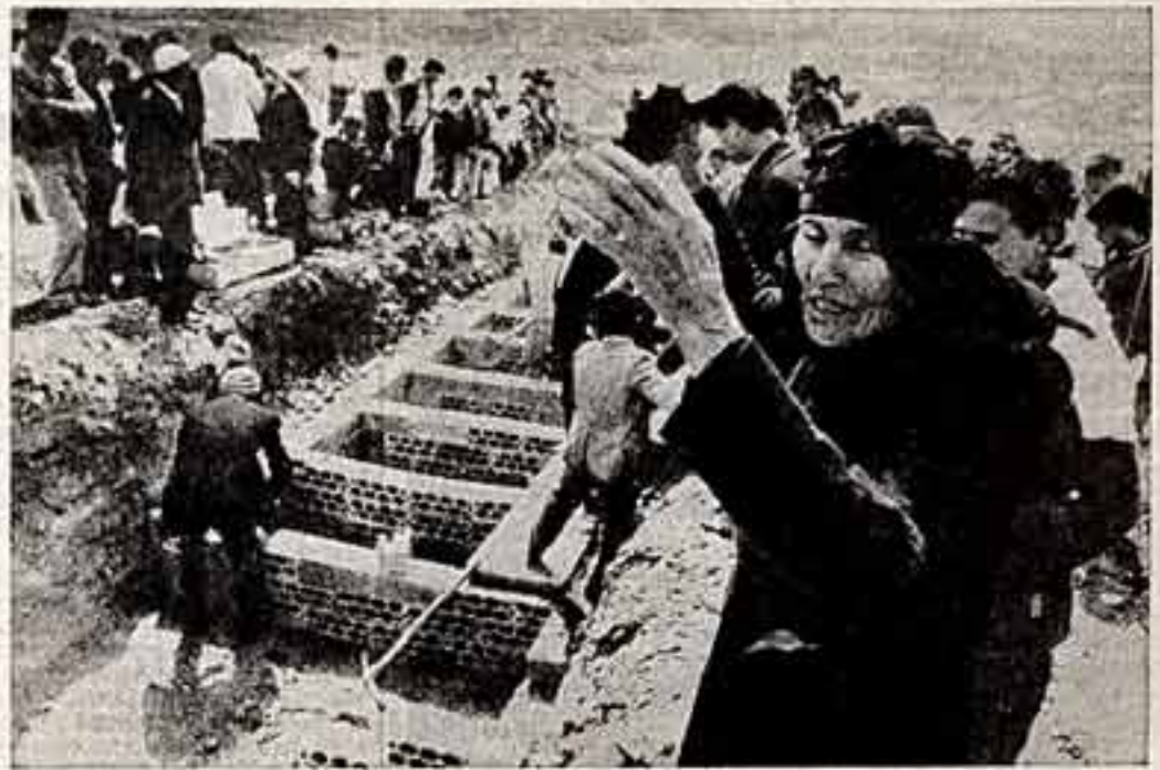
Израильская солдатия продолжает карательные операции против мирных жителей в деревне на юге Ливана. В результате этих варварских акций от рук сионистских палачей гибнут не в чем не повинные люди. Десятки мирных граждан брошены в тюрьмы. Ливанские газеты привели уточненные данные о результатах учений оккупантов: кровавой расправы над жителями деревень, расположенных в районе Сайды. От рук израильских головорезов погибли 30 человек и около 70 получили тяжелые ранения.