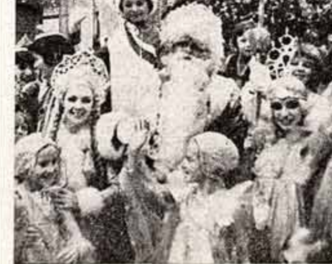
Главног елка страны в Кремлевском Дворце съездов.