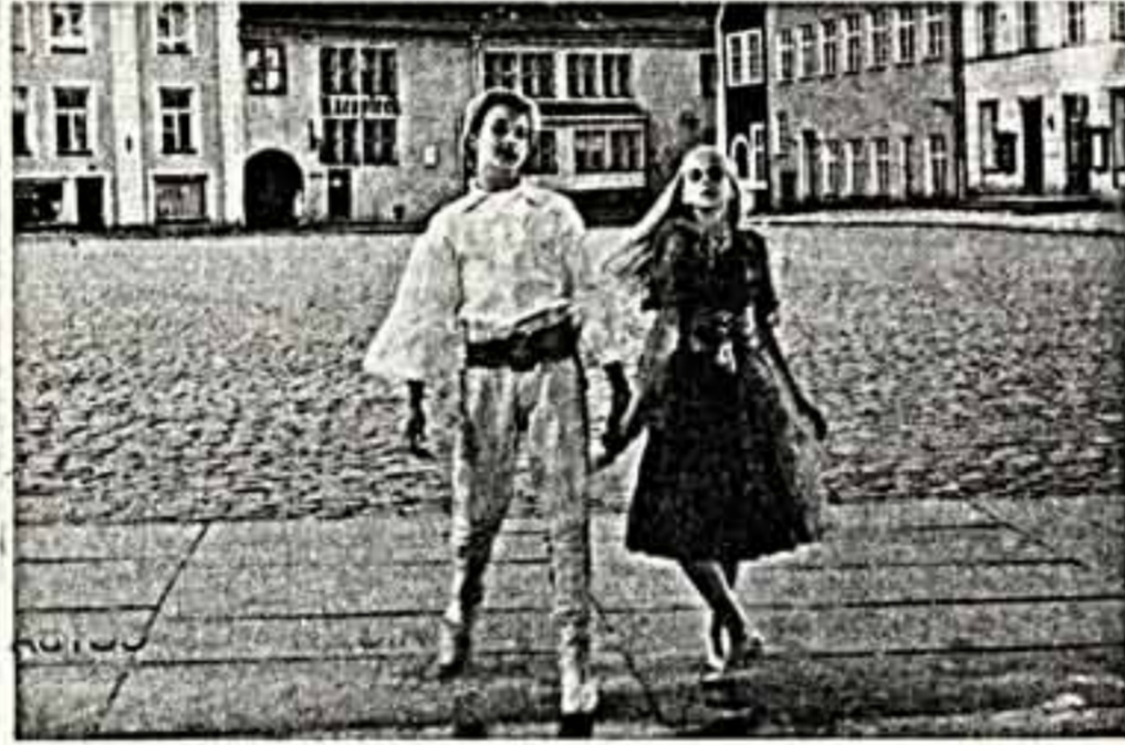
Кадр из телефильма «Выше Радуги». (Одесская киностудия).

Может ли кинематограф, находясь в прямой зависимости от кассовых сборов, постоянно воспитывать зрительский вкус? Вряд ли. Иное положение у телевидения: оно находится на достоянии государства. И именно поэтому должно создавать художественные ценности, помогающие человеку подняться на более высокую ступень культуры. А фильму-дубликату телепрограмм, конечно же, не нужны.