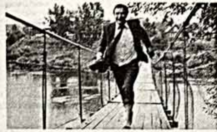
Кадр из телефильма «Картинка»...