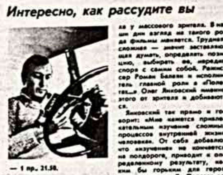
«Полеты во сне и наяву» — трудная картина еще совсем недавно считалась скучной...