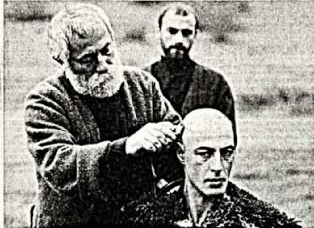
Кадр из телефильма «Песня об Арсене». («Грузия-фильм»).