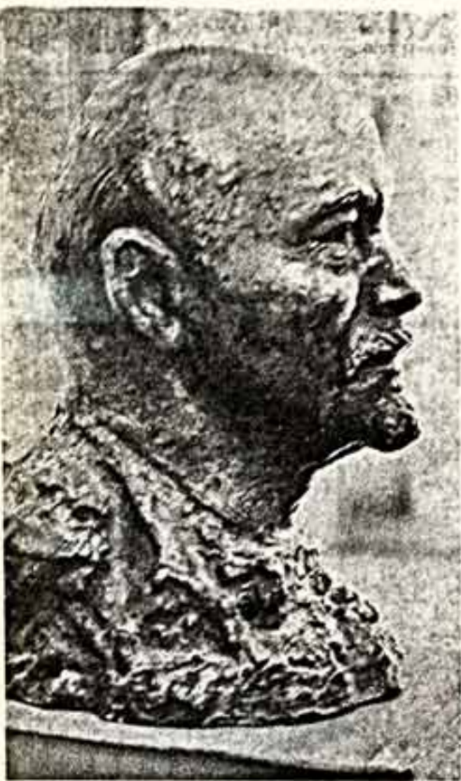
С. ЛЕБЕДЕВА. В. И. Ленин.