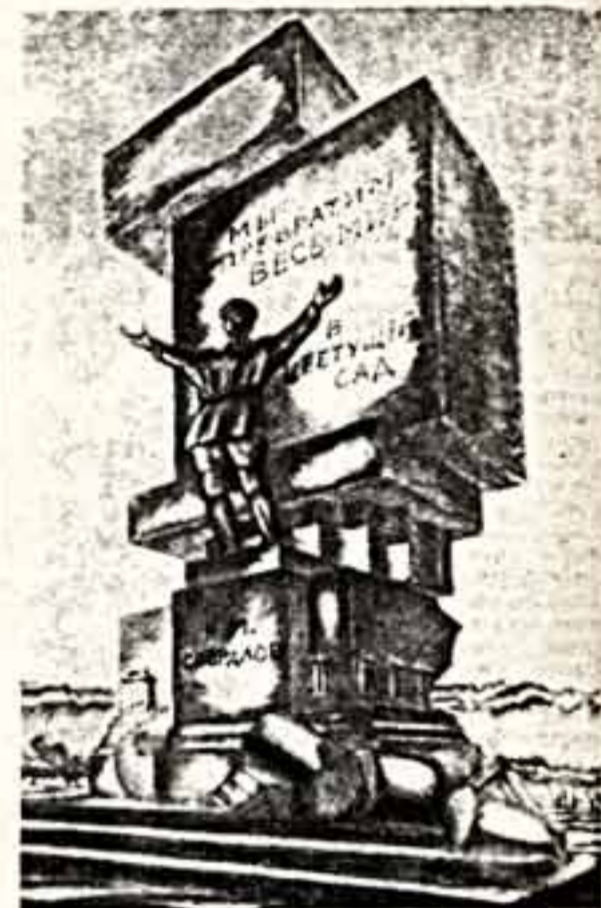
Н. ФОМИН. Памятник Я. М. Свердлову.