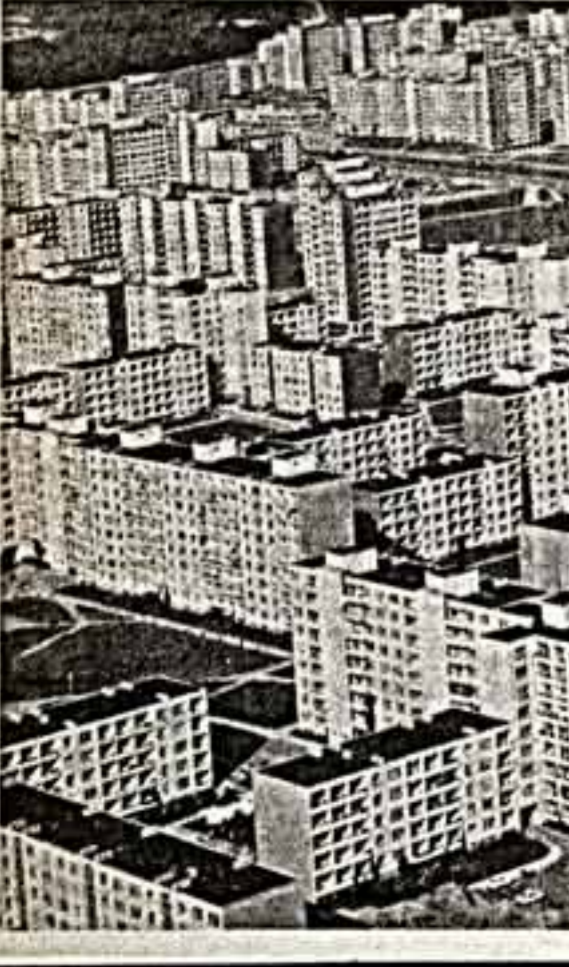
Силуэты нового Визальса. Возрождается старый Губайлас.