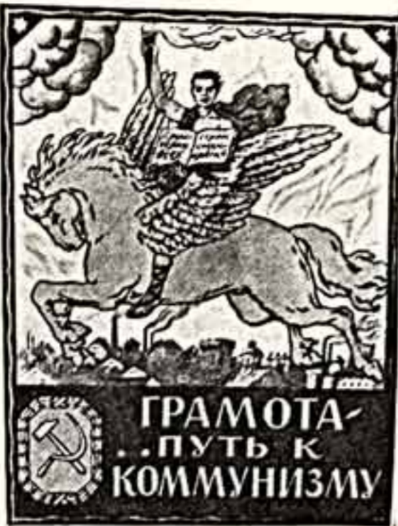
Плакат. Грамота — путь к коммунизму.