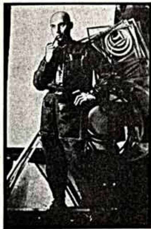
А. РОДЧЕНКО. Автопортрет.