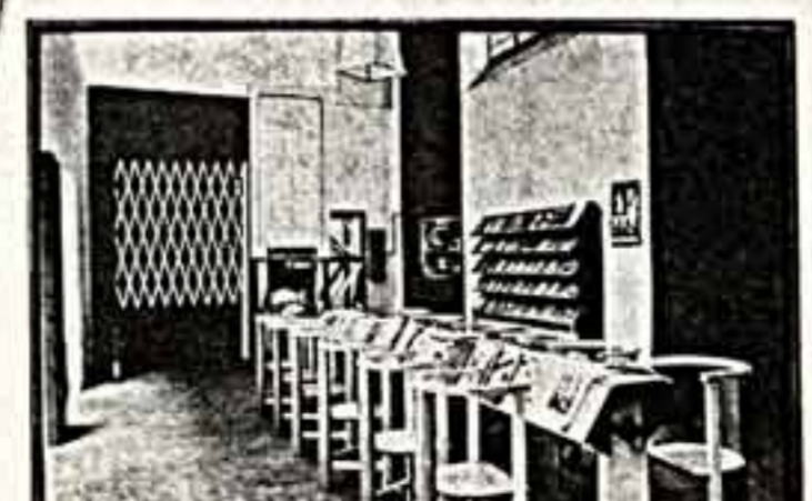
А. РОДЧЕНКО. Интерьер рабочего клуба.