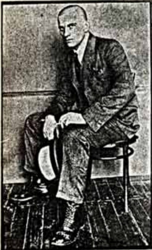
А. РОДЧЕНКО. Портрет Малковского.