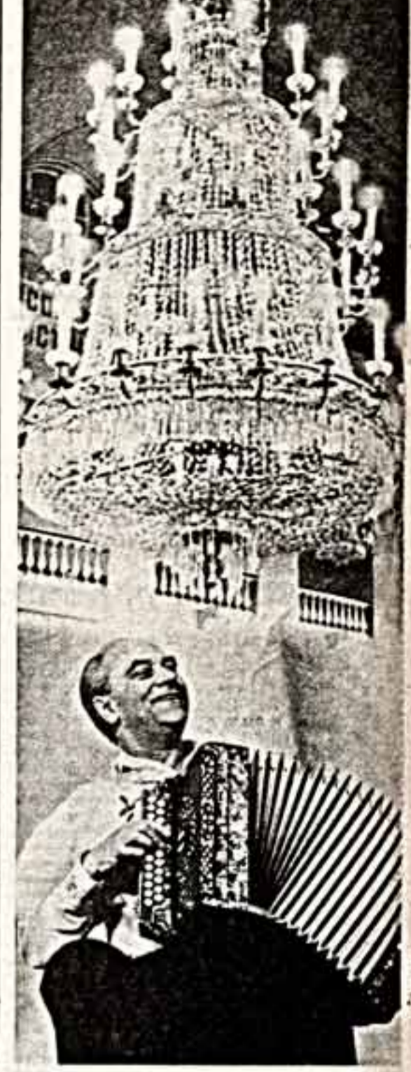
Неделя бала, гармонки, аккордеона была организована Всесоюзным музыкальным обществом, Москонцертом и газетой «Советская культура».

собранный в слыша горестное восклицание: «Нормальную, спокойную литературу никто читать не хочет! Когда, в кои веки русская классика была спокойной? Разве не было раз и навсегда сказано: «Уют — нет. Покой — нет». На другом собрании один оратор назвал ряд центральных газет и журналов проповедниками «калитуации» перед Западом. Нет, калитуация перед Западом будет наша гражданская трусость, если с позиций откровенной нашей гласности мы снова сползем на позиции умиротворения, приспособленчества. Нельзя революцию делать без революционных преобразований. Нельзя осуществлять перестройку, ничего не перестраивая. Сопротивление перестройке — это доказательство того, что перестройка идет.