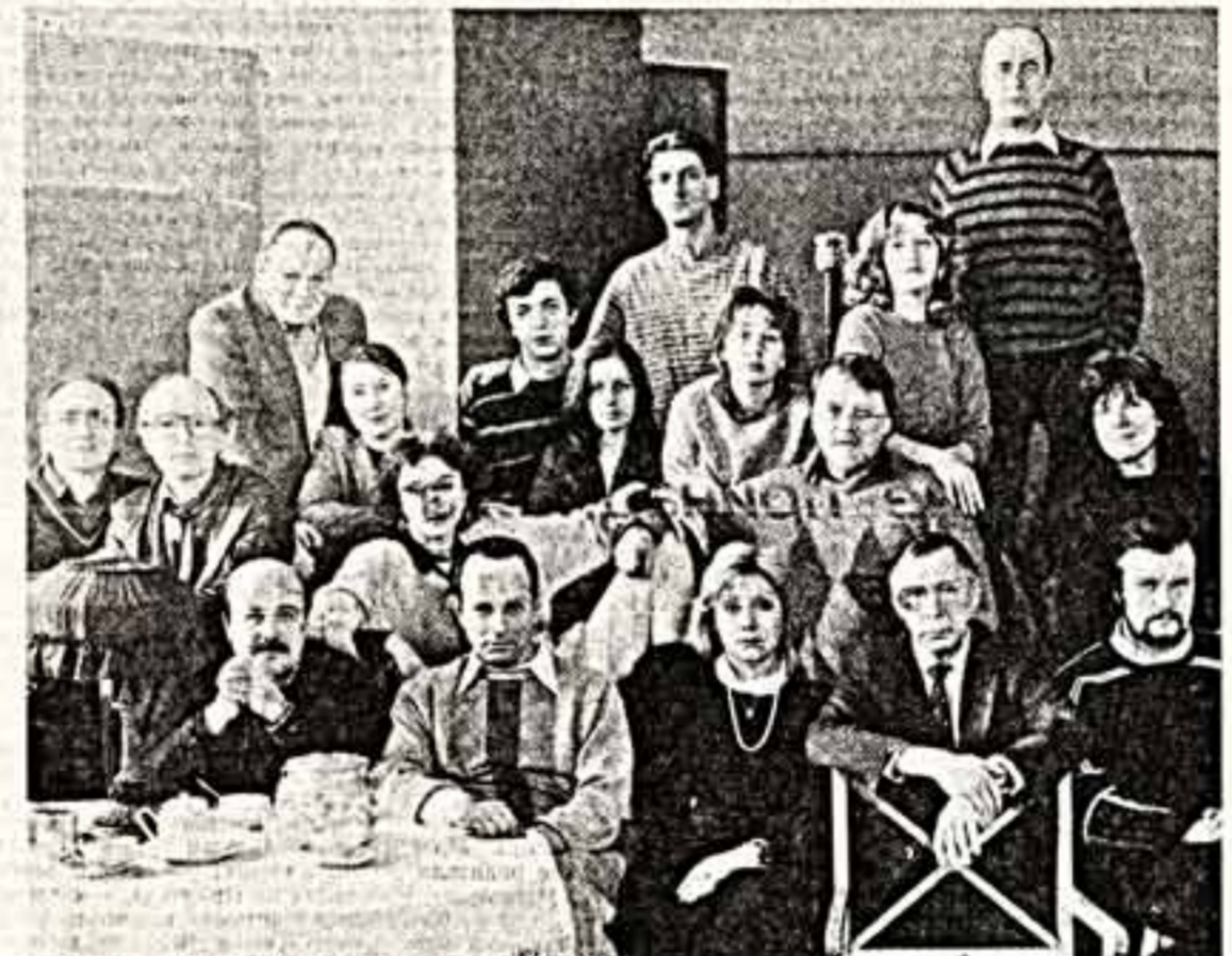
Московский Художественный академический театр, возглавляемый О. Н. Ефремовым, радует новоселье в старом доме — в проезде Художественного театра. Снимок на память после репетиции.

Кого меня спрашивают, верю ли я, что искусство способно благотворно влиять на жизнь общества, в ответ уверенно говорю: да, верю. Если бы не верил, не стал бы, не смог бы столько лет ни заниматься. Но главное не во мне и даже не в том, что история искусства многократно подтверждала свою власть над людьми, над их представлениями не только о добре и зле, но и о самой жизни. Главное в сегодняшнем жадном и все увеличивающемся интересе, с которым все наше общество отозвалось на правду, что пришла к нам не только со страниц партийных и государственных документов, но была введена искусством. Литературой.