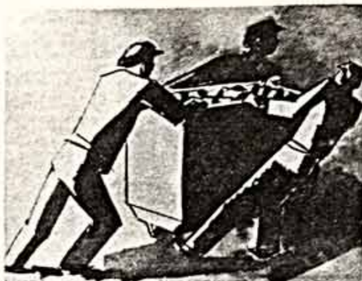
Ю. ПИМЕНОВ. Грузчики. 1924 г.