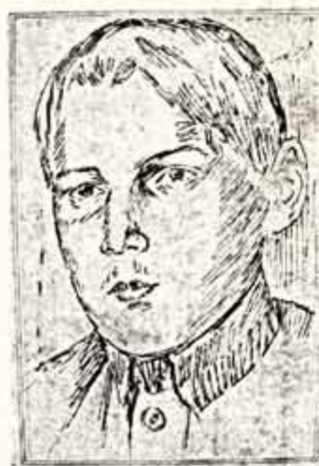
К. ПЕТРОВ-ВОДИН. Портрет молодого человека. 1921 г.