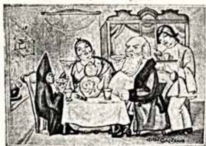
С. СУДЕВКИН. Чаепитие под машину. Эскиз занавеса. 1920 г.