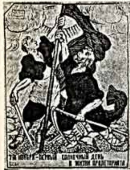
Плакат. 7 ноября — первый солнечный день в жизни пролетариата.