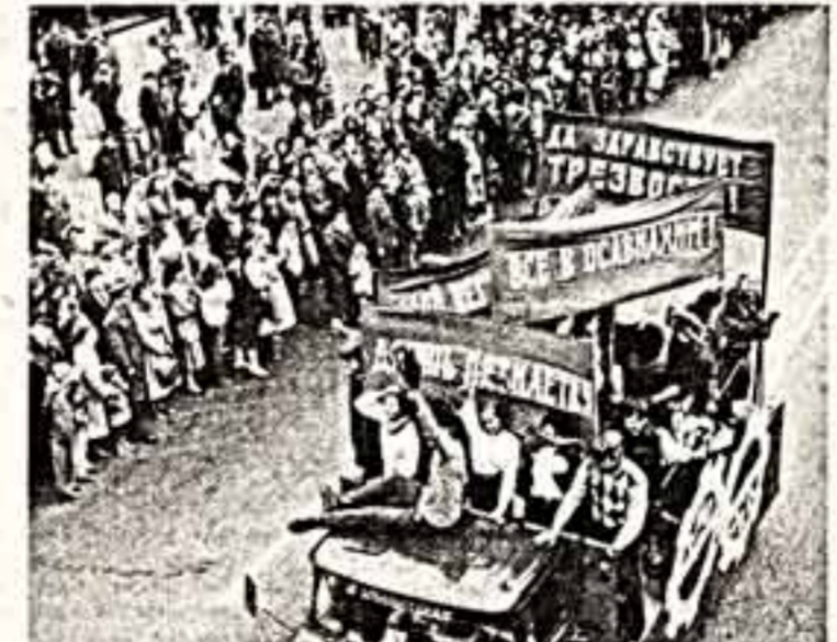
Гимназ Москва в торжественном открытии на Красной площади начала празднования Дня города. Он был посвящен 70-летию Великой Октябрьской социалистической революции и 840-летию со дня основания Москвы. Вы видите театрализованное представление на Садовом кольце.