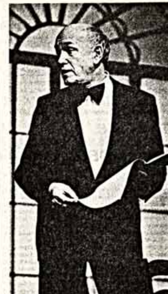
Всем миру известно имя Святослава Рихтера. А не так давно о его блестящем искусстве упоминали тысячи людей — жители Сибири и Дальнего Востока. Артисты Большого театра выступают не только на своей прославленной сцене, но и на подмостках левых клубов и дворцов культуры. «Шопениана» в ДК завода «Серп и Молот».

Как мы преступно мало знали, Да что скрывать — боялись звать, Пойми теперь, когда нам гнали, Когда мы сами стали гнать, — не в них ли ответ! Научились гнать и различили видеть реальное и, вместо того чтобы безбоязненно сказать себе об этом, занялись самоуверждением. За счет других в первую очередь. К чему это приводит, понять нетрудно: и оторжению от сегодняшней жизни, от ее великих революционных свершений, и собственному творческому бессилию.