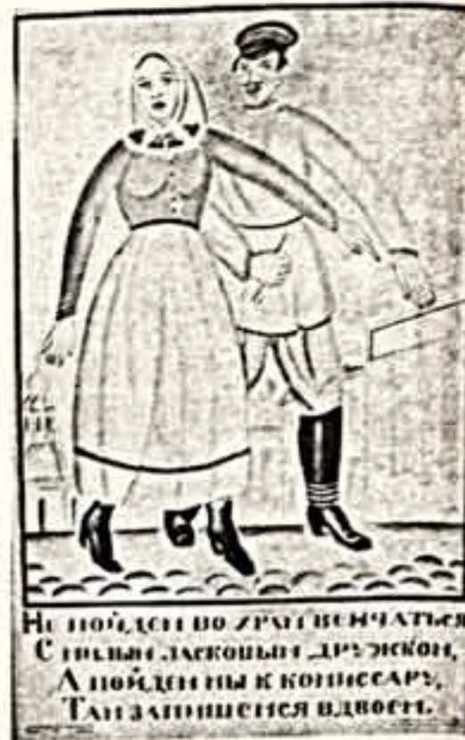
НЕ ПОЙДЕШЬ ПО ЗЕМЛИ ВЕЧАТЬСЯ Сильные законы ДРЕВНОСТИ, ПОЙДЕШЬ К КОМПЬЮТЕРУ, ТАК ЗАПОНЕШЬСЯ ВДВОЕ.