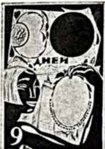
С. ЧЕХОВИИ. Эскиз обложки для иллюстрированного еженедельника «30 дней» № 9, 1927 г.