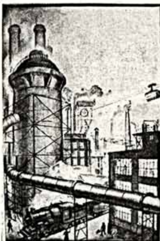
А. ВЕДЕРНИКОВ. Индустриальный пейзаж. Эскиз книжной обложки. 1926 г. А. ДЕЙНЕКА. Заседание. Иллюстрация для журнала «У станка».