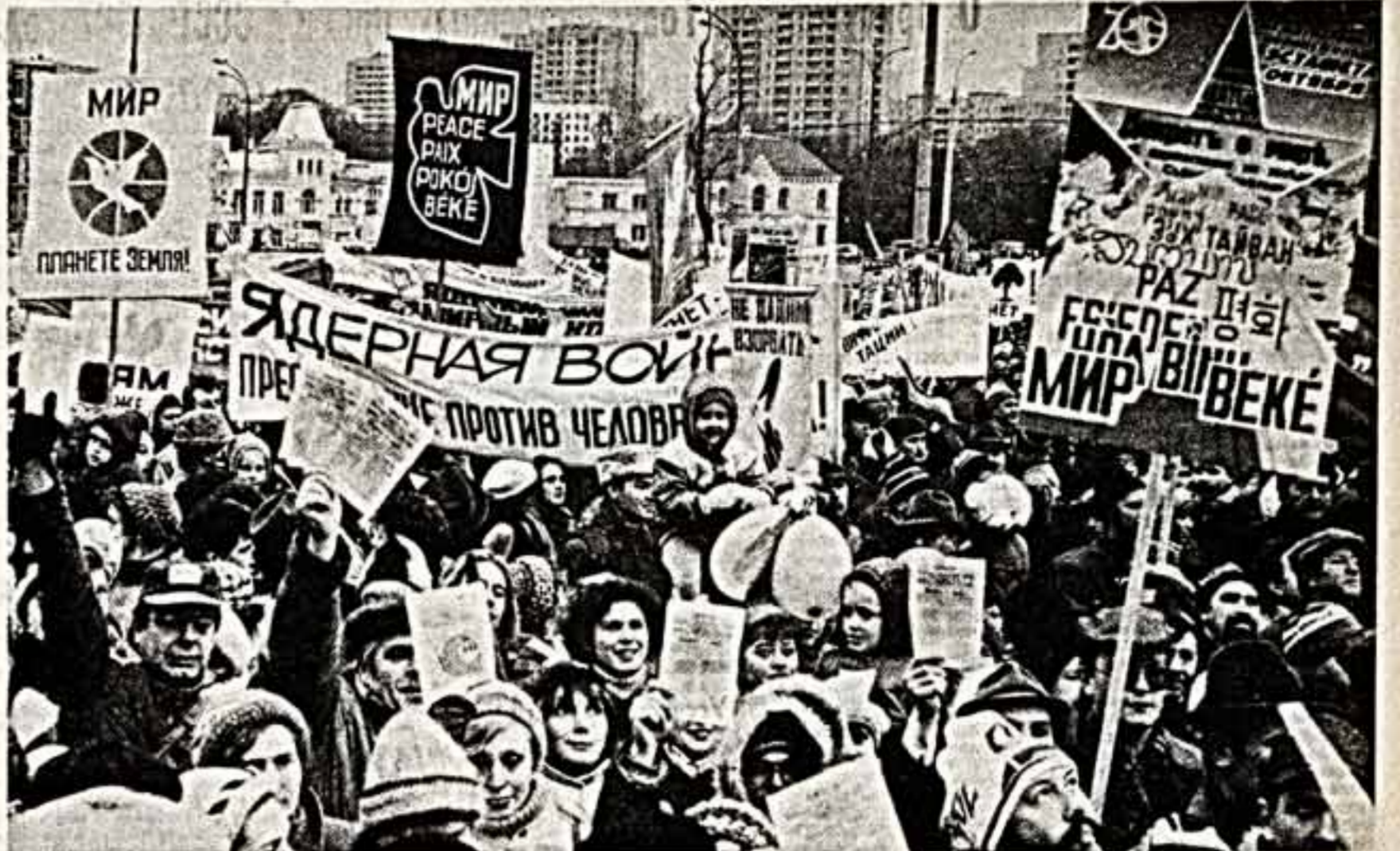
● Мир победит войну!

Все свои доходы в личную и деловую форму Искитимский горком заложил в служебный записке на имя первого секретаря обкома партии. А пока решается судьба искитимского эксперимента, сами они работают давно уже не в экспериментальном режиме, понимают, что на данном этапе перестройки самым заводчанам, говоря словами Ленина, становится улучшение внутреннее, не яркое, не бросающееся в глаза, но видное сразу, улучшение труда, его постановки, его результатов... Т. СИТНИКОВА. (Наш соб. корр.) ИСКИТИМ — НОВОСИБИРСК.