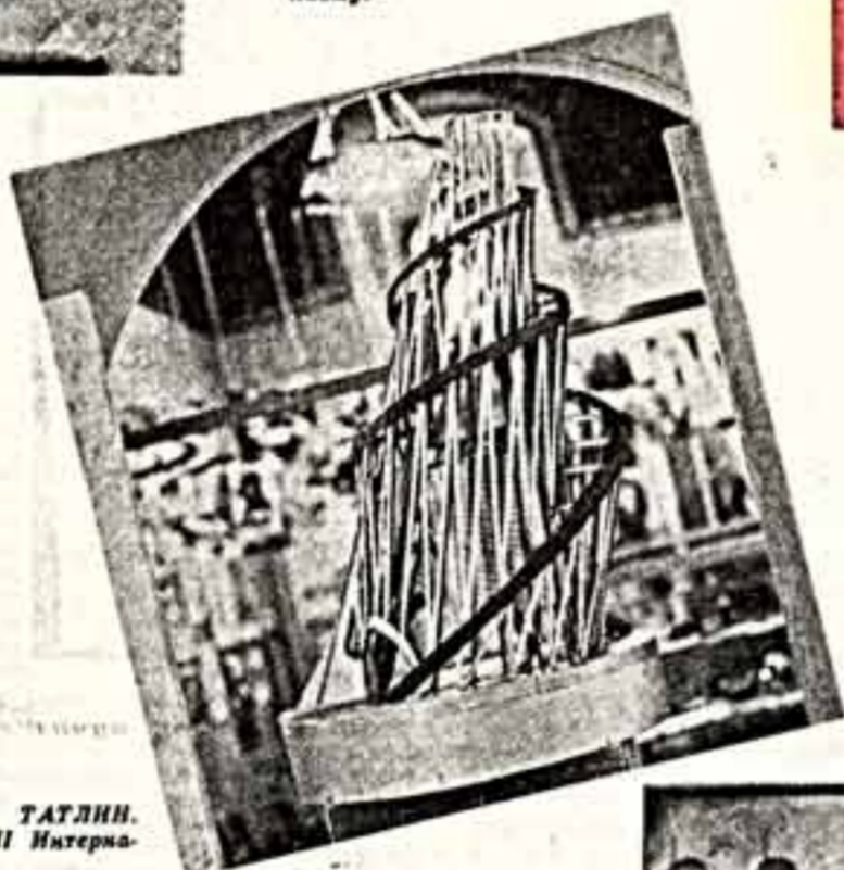
В. ТАТЛИН. Башня III Интернационала.