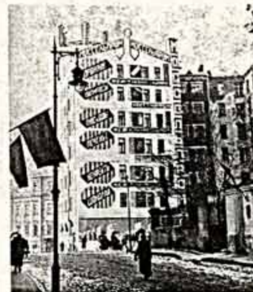
Афиша спектакля «Мандат» в Театре имени Вс. Мейерхольда. 1925 г.