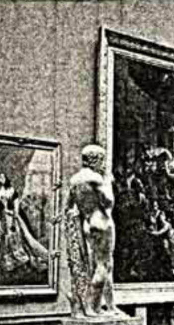
Зал Русского музея