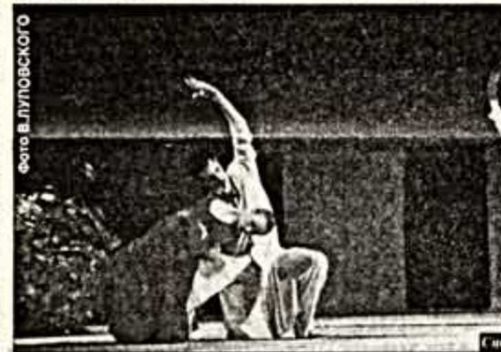
Сцена из балета "Ромео и Джульетта"