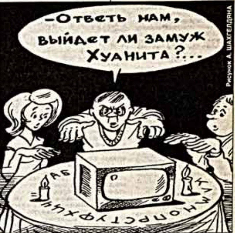
Рисунки А. ШАХТЕЛДИН