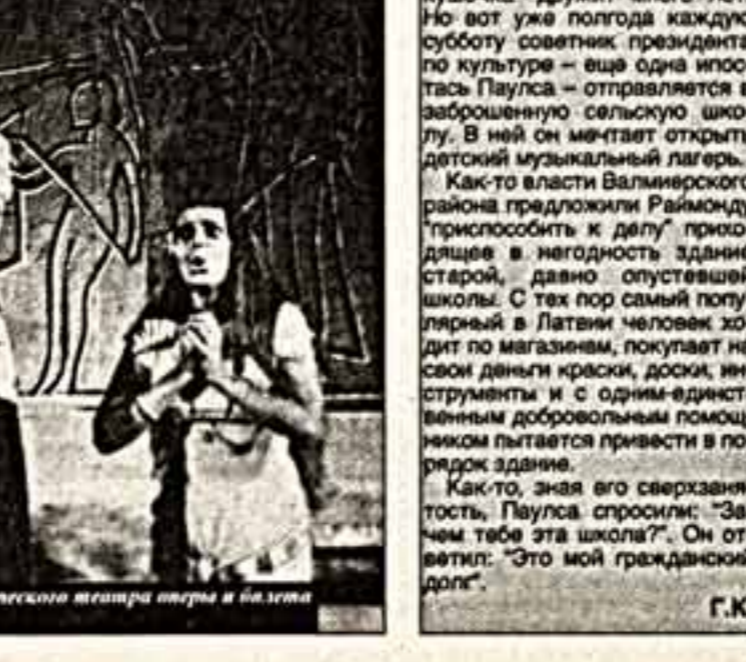
Сцена из оперы "Аида" Академического театра оперы и балета имени Саидмурата Айти

Несомненно удачей Дней стал спектакль Таджикского академического театра имени Паути "Эдип" Софокла в постановке известного режиссера и актера, народного артиста СССР, лауреата Государственной премии СССР Хашима Гадоева. В самой республике "Эдип" был показан более ста раз, и каждый спектакль зрители принимали как премьеру. "Мы не только отошли от привычного восприятия драмы великого Софокла, — рассказывает Хашим Гадоев, — в нашей постановке Эдип не просто царь, он прежде всего человек со своими слабостями и комплексами. А то, что артистов долго не отпускали за кулисы — свидетельство их мастерства. Так считает сам режиссер, и с ним, уверен, согласны те сотни москвичей, которым удалось посмотреть эту постановку.