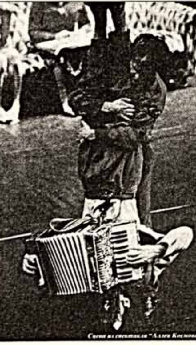
Сцена из спектакля "Аллея Космонавтов"

Музыка творилась из немзыкального, танец — из нетанцевального. Собственно, и спектакля в традиционном понимании не существовало. Пока спектакль шел на сцене Филлала Малого театра, в Гете-институте Саши Вальц занималась с группой Геннадия Абрамова, и там из бесовских пластических этюдов, обрывков жеста, магмы беспорядочных движений складывался новый спектакль (а может быть, только новый ракурс "Аллея Космонавтов") — московская версия, квинтэссенция наших "спальных" районов. Спектакль как абсолютный итог в случае Саши Вальц замесился спектаклем-процессом, спектаклем, который постоянно видоизменяется и множится, который фиксированно существует лишь в редких статических положениях — покажи.