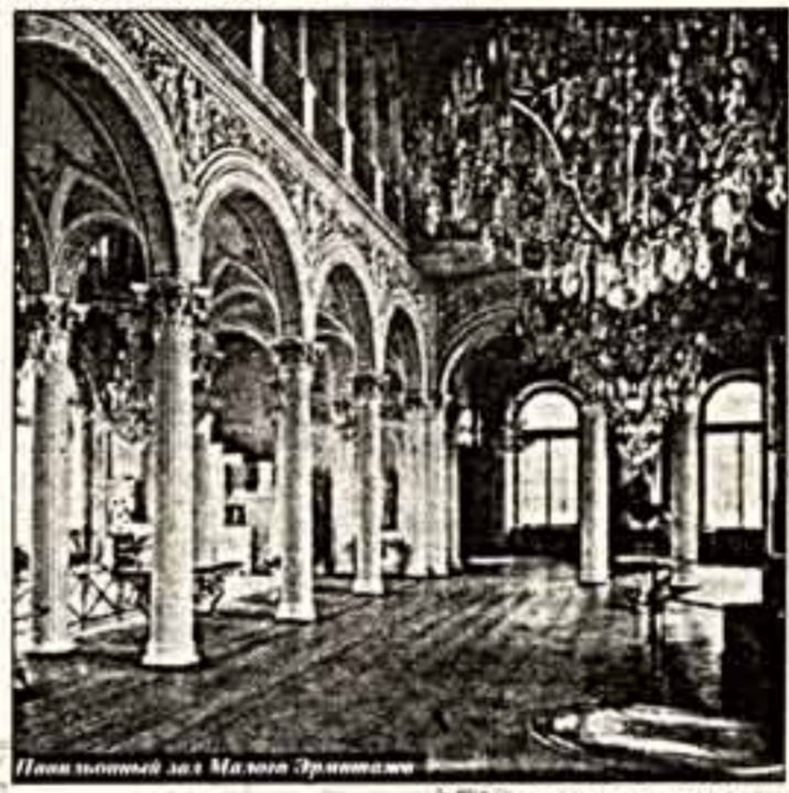
Панорамный зал Малого Эрмитажа

дерландах, ни в Финляндии, ни в Швеции эта статья правительственных расходов по крайней мере не вызывает протестов у населения. У западных предпринимателей, спонсирующих Эрмитаж, свой протест. Компания "Кока-Кола", например, вкладывает деньги в детскую программу Эрмитажа. Это на их доллары в школьном центре музея оборудован компьютерный класс, где дети — отныне они растут с именем компании на устах — обучаются компьютерной графике. Западные товаропроизводители, продвигая новую продукцию на рынок, готовят этот рынок заранее, справедливо полагают, что премиальная низкая стоимость товара гораздо быстрее и лучше ориентированный посетитель музея, нежели обитатель подворотни. Спонсирование Эрмитажа — это, помимо всего прочего, хорошая реклама. Спонсоры упоминаются в каталогах музея, назована консультантской фирмой из США "МакКинзи энд Ко", оказывающей Эрмитажу услуги в области анализа и прогноза, напечатано на входных билетах. И, наконец, западные налоговые законодательства позволяют за счет благотворительности существенно снижать налогооблагаемую базу. Фонд "Кока-Кола" снесил свою на 370 тысяч долларов, а Эрмитаж на эти деньги оборудовал крупнейшую и современную реставрационную мастерскую. К слову сказать, российское налоговое законодательство к спонсорству не располагает: общая сумма благотворительных взносов не может превышать пяти процентов облагаемой налогом прибыли. Если говорить о престиже, то к его заплесканию мы придём ещё очень и