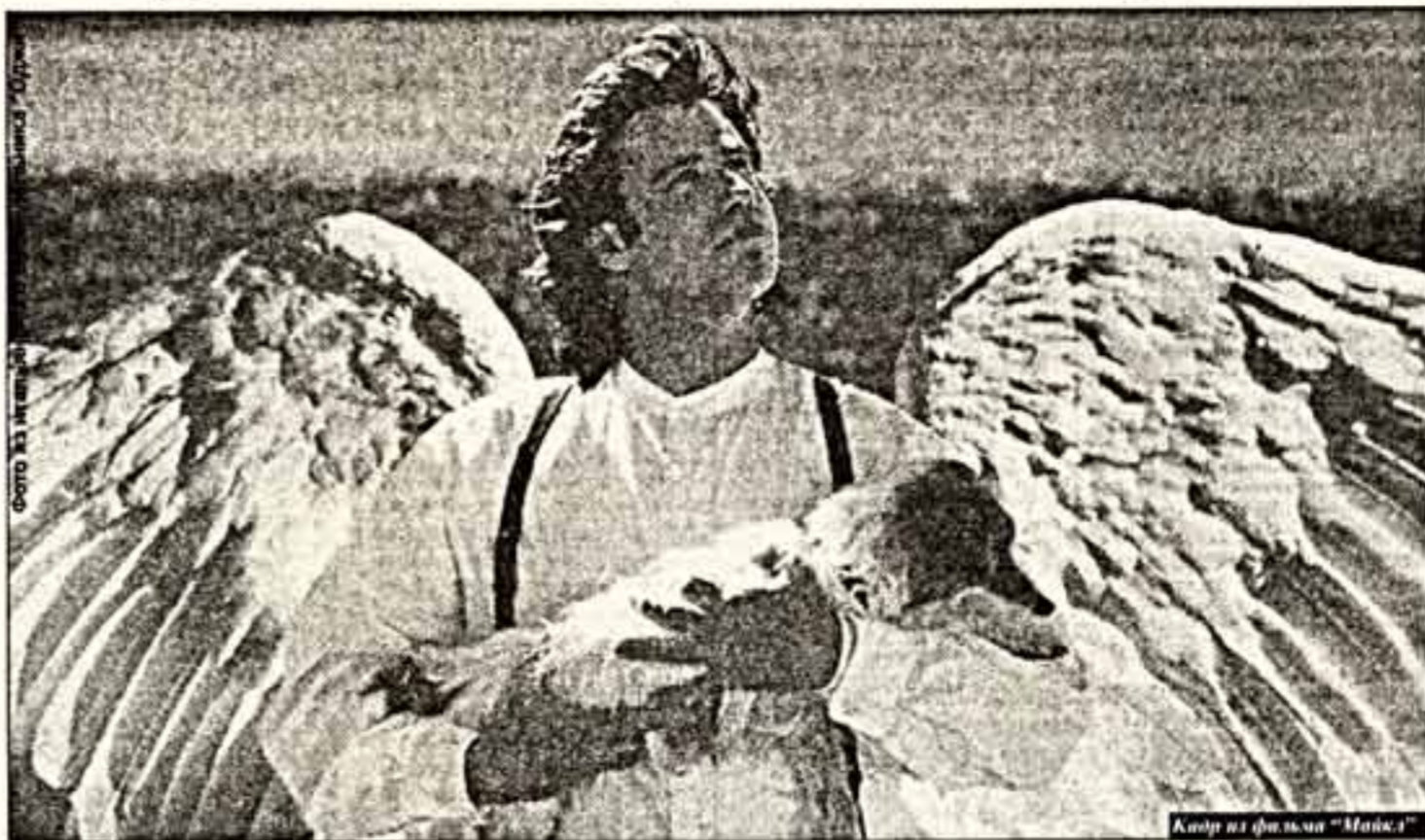
Ангел в фильме "Майкл"

И тем не менее подобное произошло — конечно же, в Америке. Благодаря изощренной фантазии голливудских "скажочников" это крылатое создание появляется в одном из моделей штата Айова. Именно здесь начинается действие нового голливудского фильма "Майкл". В главной роли сыграл Джон Траволта.