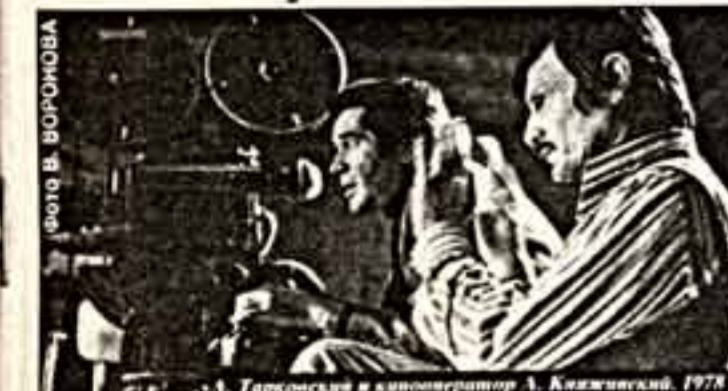
Только что, кажется, мы вспоминали Андрея Тарковского. Дескать лез, как нет его с нами. Задра кинорежиссер мог бы опознать свое 65-летие.