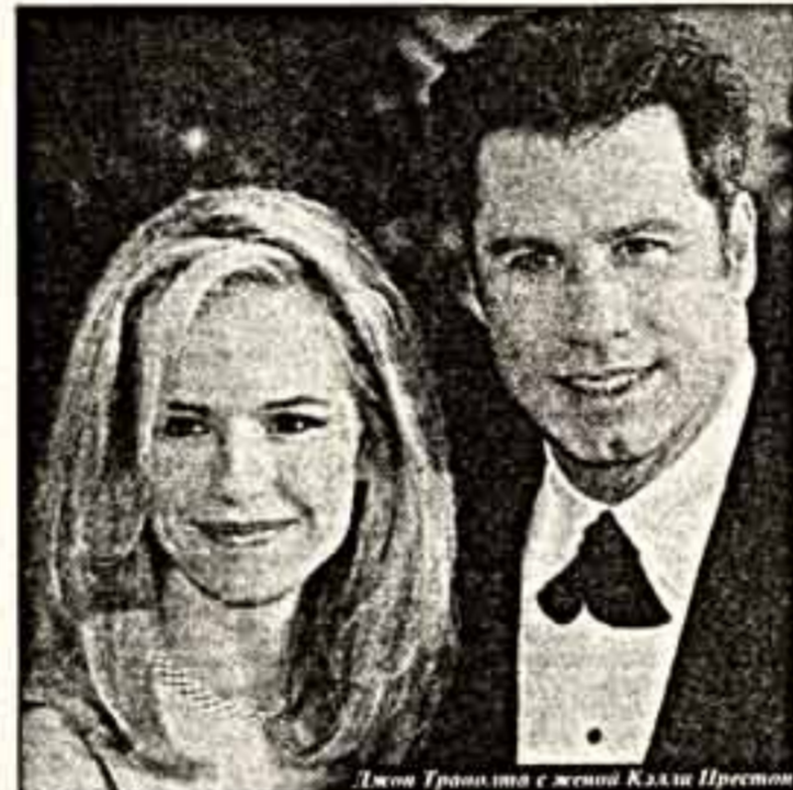
Джон Траволта с женой Келли Престон

бывшая супруга Микки Джаггера, решила воспользоваться советом своей мамы: "Лучший способ удерзать мужчину — быть хорошей хозяйкой". Реши окончательно расстаться с мужем, она стала вдруг проявлять чудеса искусства домохозяйки. Это, очевидно, провозвело впечатление на капризного Микки. Фотографы перехватили его заинтересованный взгляд, брошенный на жену во время лондонского дефиле Vivienne Westwood.