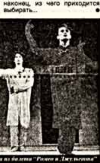
Сцена из балета "Ромео и Джульетта"