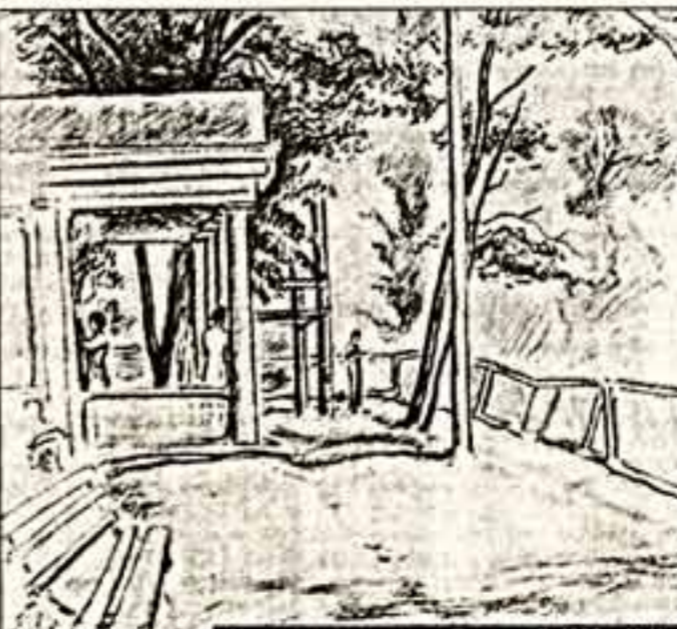
Портреты культуры имени Горького. 1915 - 1941 гг.

Недавно в Московском цирке на Цветном бульваре произошло знаменательное и необычное для него событие - он получил в дар от государственного выставочного зала "Ковчег" большую художественную коллекцию...