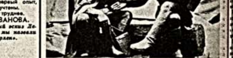
Евграф КОНИЧИН.

Памятник встанет на центральной площади Смоленска. Его предполагается открыть 2 мая, в день победы в войне. Памятник встанет на центральной площади Смоленска. Его предполагается открыть 2 мая, в день победы в войне.