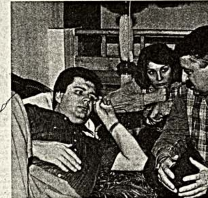
Я все время задаю невольные вопросы... Я — а мы — оправдываемся. Простите. — Хорошо. Давайте с другой стороны. Почему Якубовский? Зачем! Н. — Повторюсь. Если бы мы попали на эту дачу, непременно стали бы

экран выдает как сенсационный. У нас обратный эффект. Мы выданы срочную сенсацию, и нас же обвиняют в "подкупности" в эфире, без доказательств, без документов. За такое в суд подуют. — В эфире мы написали "В финансировании не нуждаемся". Это значит? — РЕН-ТВ дает телюж — мы снимаем. Смета — это их работа. Зарабатываем деньги только в том случае, если фильм продается. Таким образом, условия нашего контракта. Уже есть запросы из Канады, США, насколько нам известно. — Странный разговор получает-