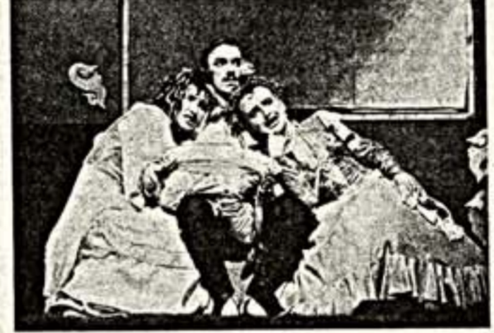
Сцена из спектакля "Я вас люблю и обожаю"