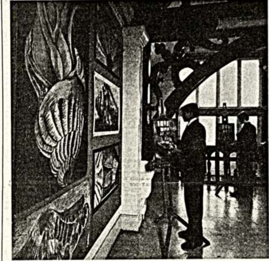
СО ЗНАКОМ КАЧЕСТВА

ционную направленность, передачи для нее будут предоставлять телестудии земель ФРГ, входящие в систему государственной телерадиокомпания АРД.