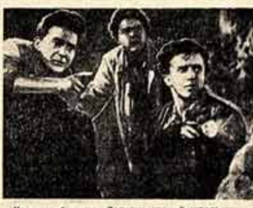
Кадр из фильма «Загадка старой штольни».

Две кинокартины наших друзей — польские «Кто он?» и чехословацкая «Загадка старой штольни» — мыши на экраны страны почти одновременно и демонстрируются с notable успехом. Интерес, проявляемый к ним нашим зрителем, вызван не только хорошей разработкой сценария, удачным режиссурой, талантливым актерским составом, но и тем, что это фильмы о первой и второй мировой войнах — о борьбе за свободу и независимость родины, о прорыве вражеских оцеплений, о героическом пути, о борьбе за свободу и независимость родины.