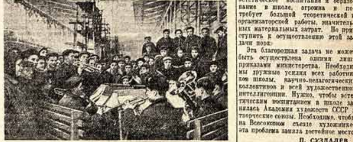
Любители музыки — рабочие судорожного цеха № 3 завода «Красин» Советска организовали ансамбль. На сцене: солисты ансамбля в обеденный перерыв в цехе.