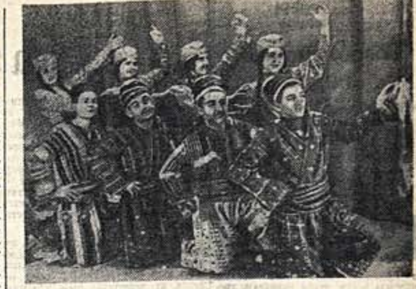
Фестиваль танца Лорейной танец в исполнении ансамбля работников начальных и средних школ Армянской ССР