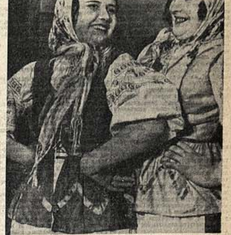
Фестиваль танца «Львовичка», народный белорусский танец