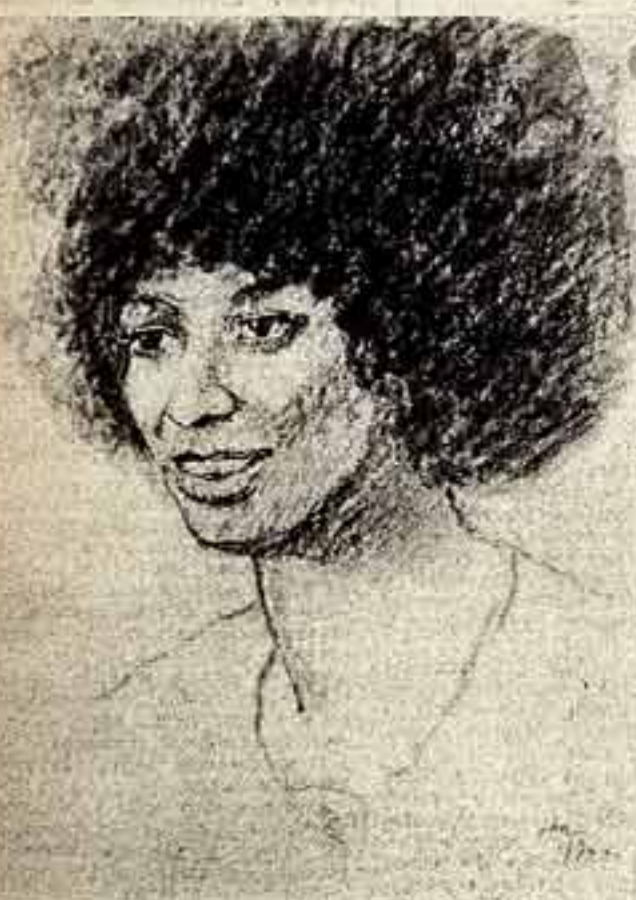
Анджела Д. ДЭВИС. 30 августа 1972 года.