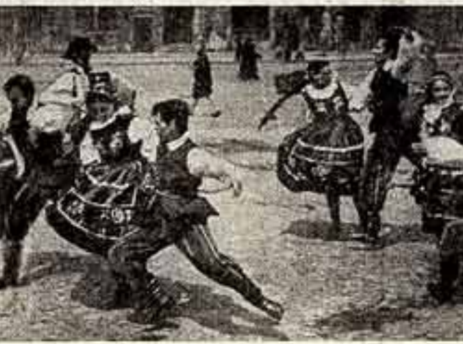
Эту огненую пляску танцуют студенты Варшавского политехнического института на старинном площади столицы, но увидели они этот народный танец в одном из отапливаемых клубов проходил в Варшаве. Участники студенческого ансамбля песни и пляски, будущие музыканты, музыканты, о увлечении готовят свои разнообразные программы, которые они покажут зрителю не только польским, но и зарубежным. На сцене ансамбля — 500 исполнителей, которые они дали в нескольких странах Европы: Польша и страны Венгрии, Голландия, Финляндия.

● Известная французская актриса Анни Жирардо будет сниматься в фильме режиссера Андре Кайата «Нет дыма без огня». Фильм будущего фильма — это борьба семейной чести с клеветой. Партнерами Жирардо будут Мирей Дарк и Бернар Фрессон.