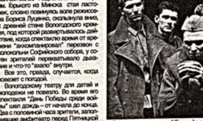
Сцена из спектакля "Баллада о солдате" Владимирского драмтеатра

Главным же была тема прошедшей, далекой и близкой войны. Фестиваль посвящался 60-летию Великой Победы. Поначалу даже странно показалось — уж месяц, как отгремели торжественные залпы и фajerверки... Страна, как говорится, перешла к мирным делам. Правда, театры у нас, видимо, живут по собственным календарям... Театры Москвы (за редчайшими исключениями) великой, может быть, самой великой и гордой победы в нашей истории как бы и не заметили (все дело, знаешь ли, дело...), чего раньше никогда не случалось.