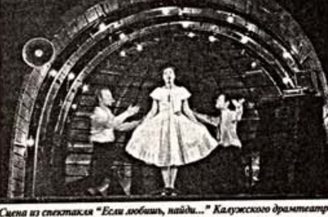
Сцена из спектакля "Есть любовь, найдись..." Калужского драмтеатра

В Вологде прошел фестиваль "Голоса истории"