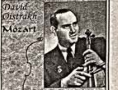
David Oistrakh Mozart