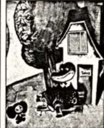
Легендарный Чебурашка нежданно обрел вторую молодость в Японии...