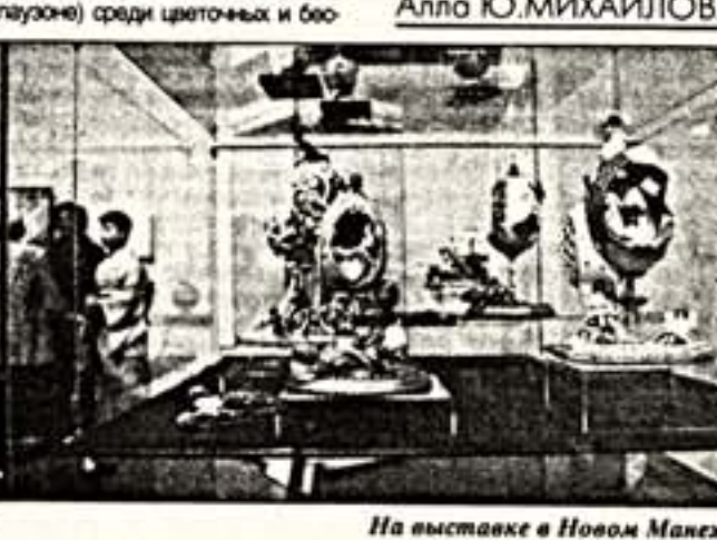
На выставке в Новом Манеже