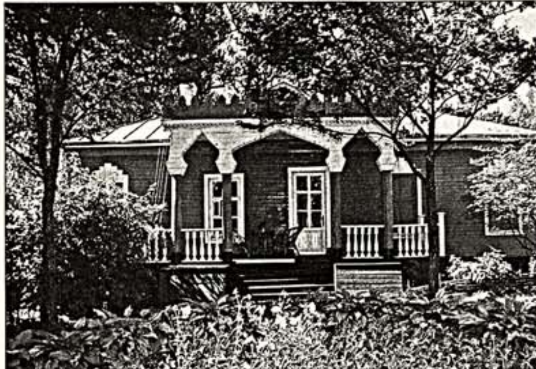
Вверху: главный дом в усадьбе "Мелихово". Внизу: фрагмент экспозиции