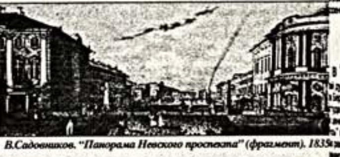
В.Садовников. "Панорама Невского проспекта" (фрагмент), 1835 г.