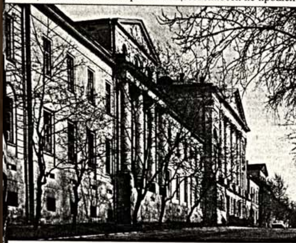
И.Етолов. Первый военный госпиталь

Проект строительства на собрании общественности не прошел