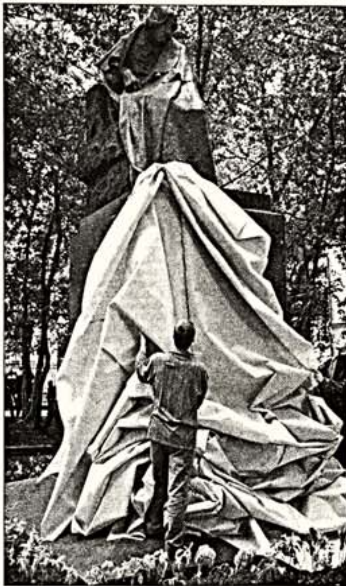
Окончание. Начало на 1-й стр.