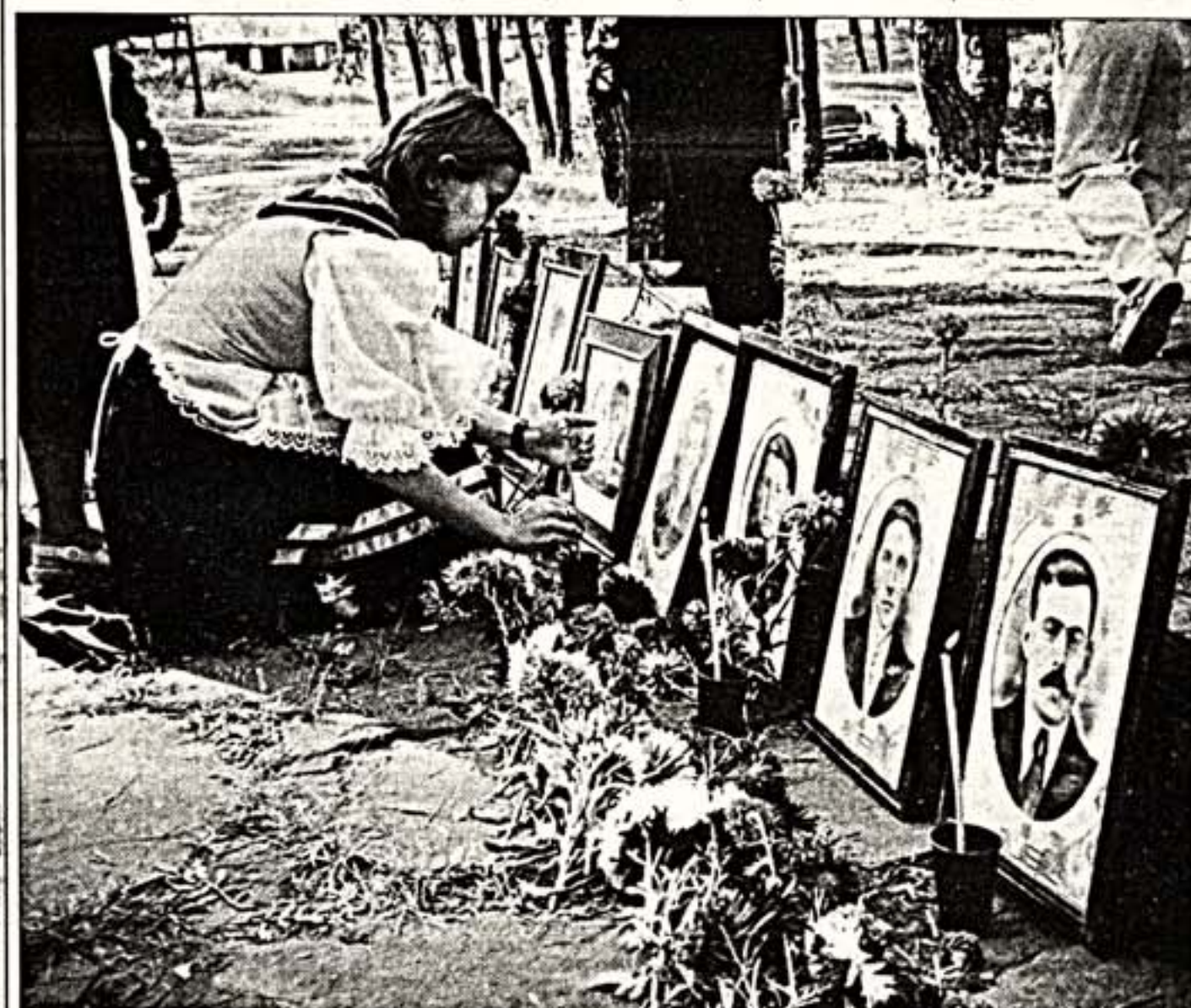
60 лет назад началась депортация российских немцев