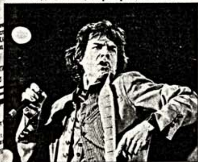
А ведь когда-то М.Джаггер собирал целые стадионы...