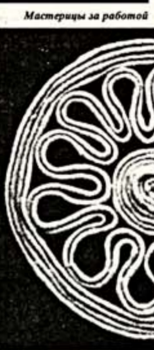
Вот такие "тетерки"