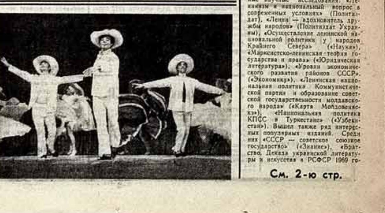
Фрагмент из «Християнской баллады».