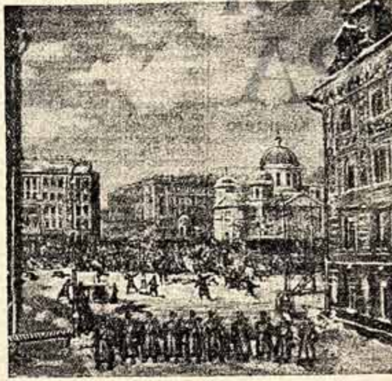
На снимке (внизу): площадь Восстания в Ленинграде. Вокруг смежной горки в центре справа, охватываемой гранитным бордюром, играют дети. На противоположной стороне — Белое здание станции «Площадь Восстания» Ленинградского метрополитена имени В. И. Ленина, слева — обновленный Невский проспект. На переднем плане виден парадный выход из Московского вокзала.

жени на парламент. Неосторожно пародировал тяжелый национализм кривле, выходящий из расхождений и декоративной всею экономическою и политическою стран.