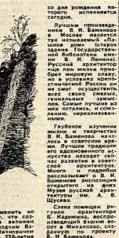
Слова помещика-революционера В. И. Баменова, воспринимавшего бытие в России...