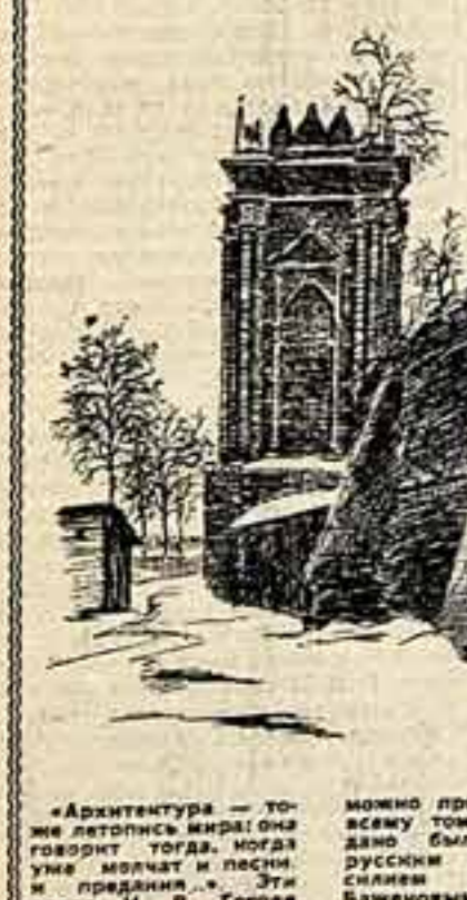
«Архитектура — это летопись мира! Она говорит тогда, когда уме молчать и песни, и предания...» Э. Г. Гоголь