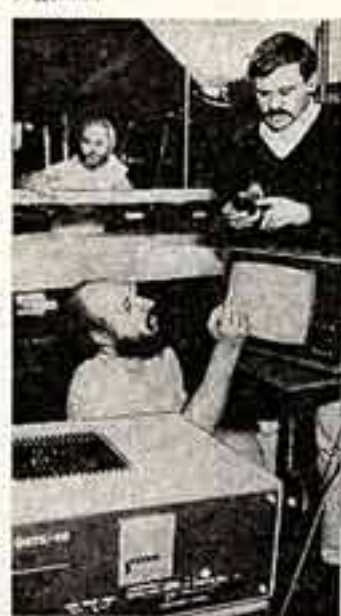
В студии имени Прометей.

Семью сотен, полнометражных художественных фильмов и около 1.600 короткометражных лент создается ежегодно в ЧССР. Студия имени Прометей в Остраве, отметившая свое 15-летие, выпускает рисованные и мультфильмы для многочисленной аудитории маленьких зрителей. Большинство работ остространных киноманиссера предназначается для телевидения.