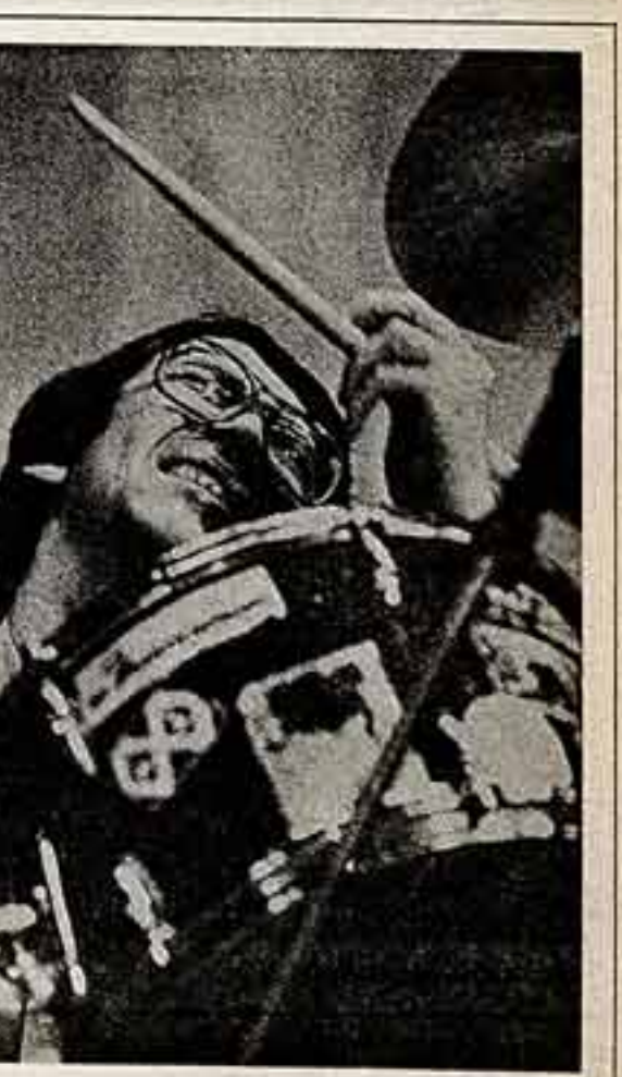
Ритмы Джона. (Неразр. Владимир Чеканов и Рафаил Галашанов.)