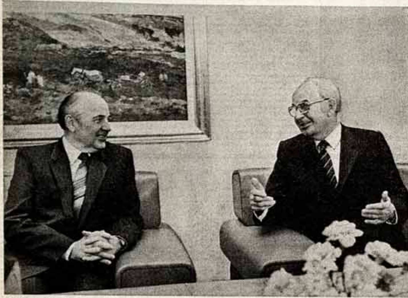
Во время беседы.