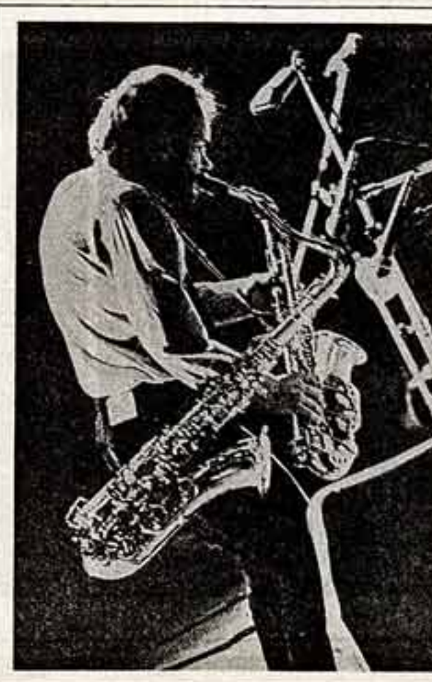
Всмотритесь в эти смилки. На наш взгляд, «фотографу удалось «схватить» главное...