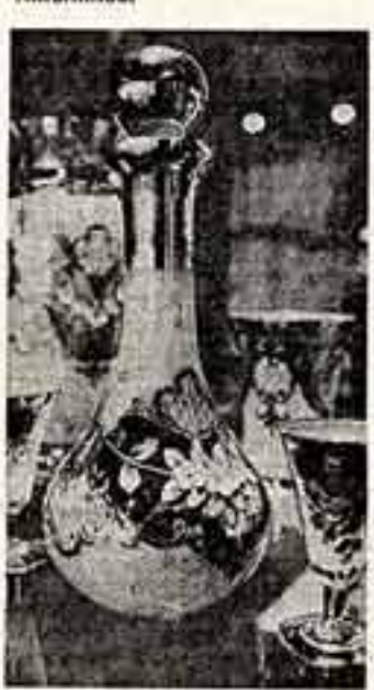
Этот набор, сделанный мастерами производственного объединения «Кристалекс», занимает достойное место в экспортерской коллекции.

Чехословацкое стекло... Эти слова вызывают в памяти изделия, отличающиеся красотой, изысканностью, тонким вкусом. Более чем в сто стран всех континентов экспортируется продукция вышеназванного предприятия. Крупнейшим покупателем ее по традиции является Советский Союз. Одним из «секретов» большого успеха чехословацких мастеров состоит в том, что они работают в постоянном поиске. В производственную программу включены программы выработки новых образцов декоративных и прикладных изделий из стекла, оригинальные модели аз, бокалов, ложек, светильников.