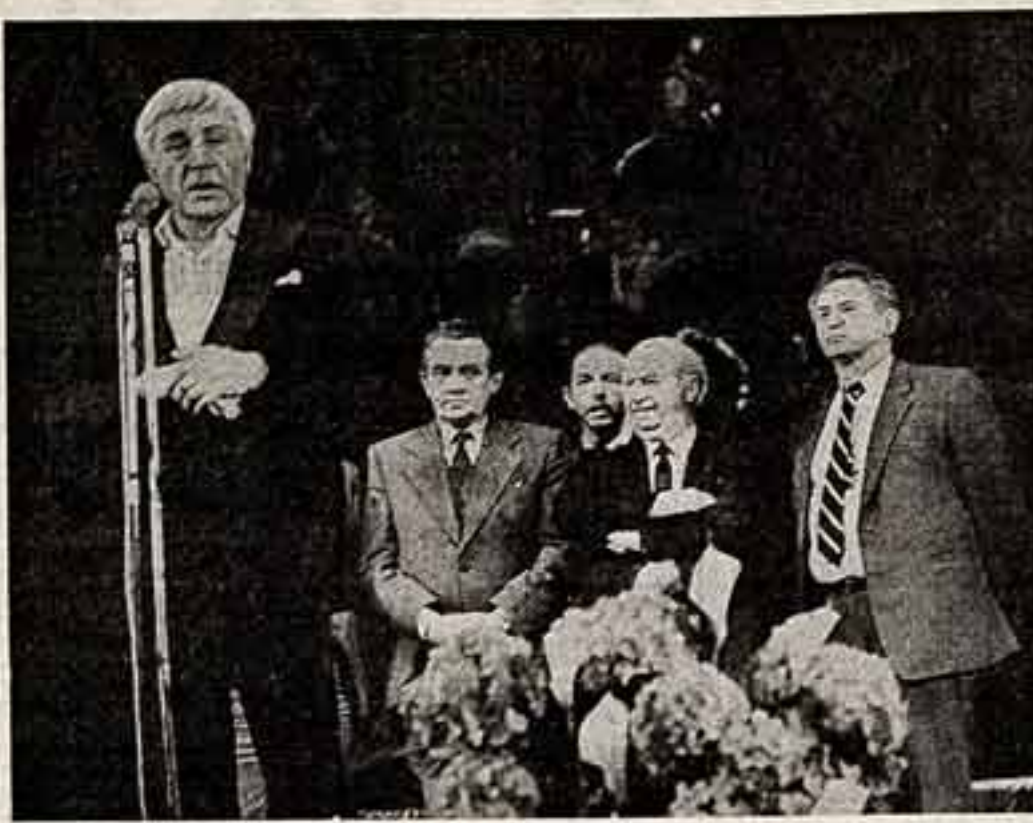
Во время встречи с членивскими патриотами во Дворце культуры ЗИЛ.

Институт марксизма-ленинизма при ЦК КПСС... В настоящее время Центральным Комитетом КПСС разрабатываются меры по коренной перестройке деятельности института.