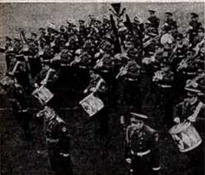
Образцовый оркестр почетного караула.