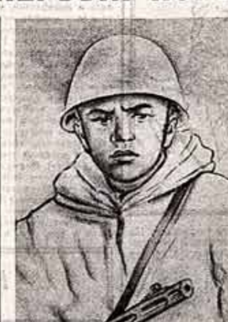
Первый лист и набрасывает землянку, в которой сидит сейчас сам и куда позвонили о подвиге. Позже его вызвали в штаб корпуса.