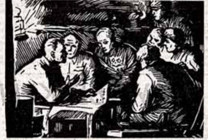
Тридцать один год назад советские воины разгромили фашистскую армию под Сталинградом и с триумфом завершили историческую битву на Волге.

Види, ВИЯЗМАТОВ, В. СМЯРНОВ, наш спец. корр. ТАШКЕНТ.