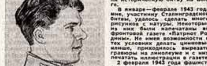
В январе — феврале 1943 года мне, участнику Сталинградской битвы, удалось сделать много рисунков с натуры. Некоторые из них были напечатаны во фронтовой газете «Литератор Родины». Не имея возможности в тех условиях сделать ценные рисунки, приходилось вырезать гравюры на динотепах и с них печатать иллюстрации в газете.