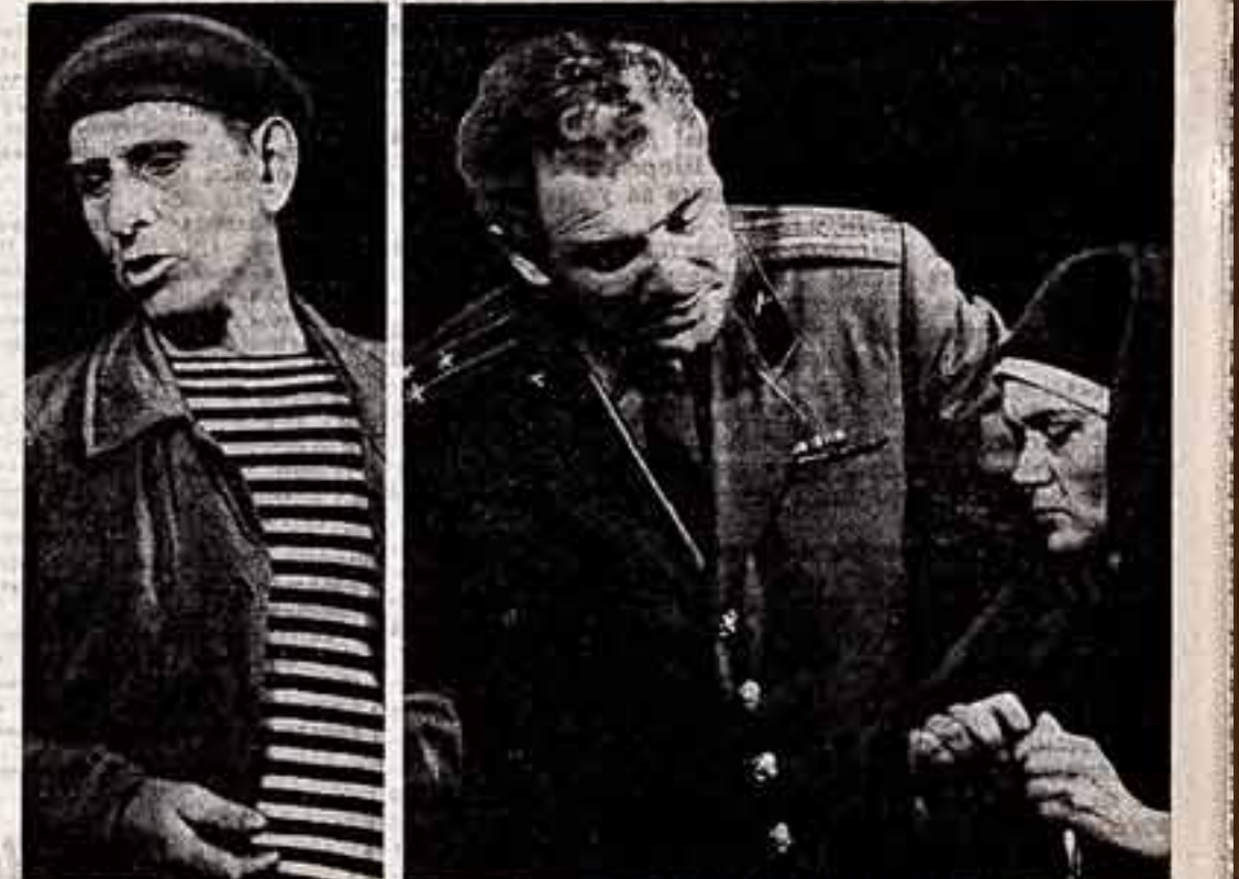
Народный театр Дома культуры поселка Елизаветинское — один из лучших коллективов художественной самодеятельности Камчатской области. Ему четыре года, он сыграл шесть пьес, пять опереток.

В результате такого внимания партийных и советских органов и улучшению условий труда и увеличению их материальной базы растет выпуск художественной продукции. Предприятия системы Художественного фонда СССР за годы восьмой пятилетки создали изделия и произведений изобразительного искусства, выполненное декоративно-прикладными и другими художественными работами на сумму свыше 700 миллионов рублей.