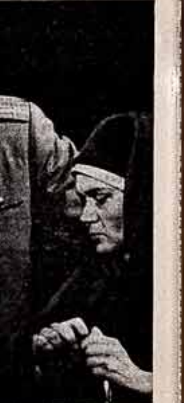
В Дворце культуры замков Светлогорского заповедника искусственный волюнтер белорусской ССР в коллективе художественной самодеятельности занимается сотней горожан. Недавно во дворец создан детский театр.