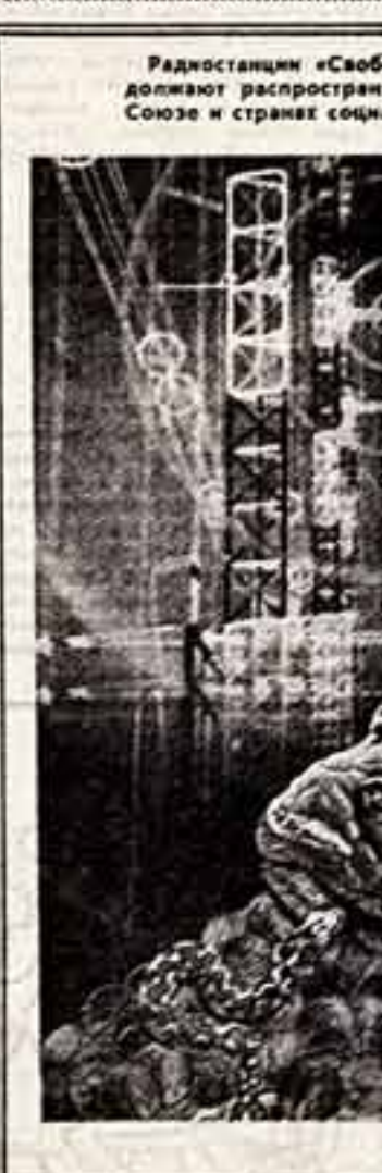
Автор фотоплаката А. Судин

Радиостанции «Свобода» и «Свободная Европа» продолжают распространять лозь и клевету в Советском Союзе и странах социализма. (Из газет).