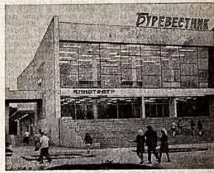
Жители и отдыхающие города-курорта Геленджик получили хороший подарок — новый широкоформатный кинотеатр «Буревестник» на 800 мест.

Центральный Комитет КПСС постановил отметить 250-летний юбилей Академии наук СССР как смотр достижений советской науки, внесшей большой вклад в дело построения социализма в СССР, создание высокообразовательной социалистической экономики, оборонного могущества страны, в развитие образования и культуры, в укрепление мира и укрепление дружбы между народами.