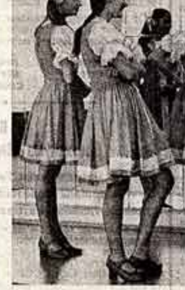
Новый спектакль «Сказка» в постановке режиссера Валентина Макарова.