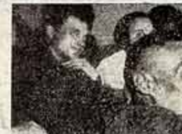
Кадр из кинофильма «Лесные люди», Совинфо, 1928 г. В. К. Арсеньев и Суиндей Геонка на прессурое кадраны во Владивостоке.