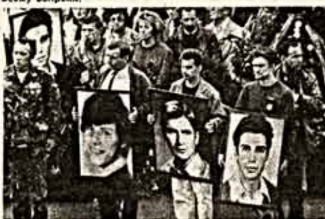
фото В. Кричевского.

Мовет быть, дама намерена были бы другие рисунки, сложилась бы другая стихия. Мовет быть, пришло бы художественное признание. Мовет быть, так ли важно? Другое существование: нина среди нас человек, промкнувший чистой, светлой верой и прозрачно, и он, не задумываясь, помертвевал всем, этой верой владимир. Илья Кричевский. Этим именем сегодня для всех все уже сказано. И не нужны комментарии. Он — смел. И сильней головах парад, памятуя мальчишка целый мир. И мечальные лепестки его мерцавшего творчества — всему вопреки — становится нина достойным тысяч, Ибо, исцеляя их, каждый, что честен, дает себе священную клетку. Негромкую. Не рассчитанную на телекамеры. Клетку себе самому. Сделав так, чтобы не требовалось снова кому-то жертвовать жизнью. Там сделать, чтобы победило приращение. Всему вопреки.