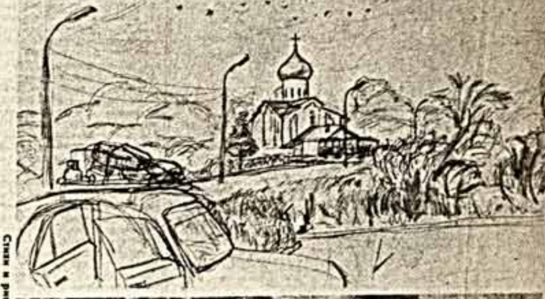
Снимок и рисунок И. Кричевского.

С каким же трудом дается нам политическая реформа! Мы непременно должны сплотиться, и не раз, расшибить себе лоб, чтобы понять в общем-то очевидную истину. Причины — стереотипы старого мышления (хотя мы усилено клянемся в приверженности новому), абсолютизация явно доказавших свою несостоятельность старых политических институтов и традиций.