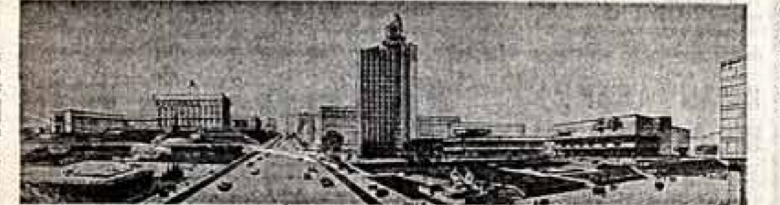
Новый культурно-общественный центр Владивостока. (Архитекторы Э. Биксон, В. Ребров, Г. Морозов, инженер Б. Михайловский).