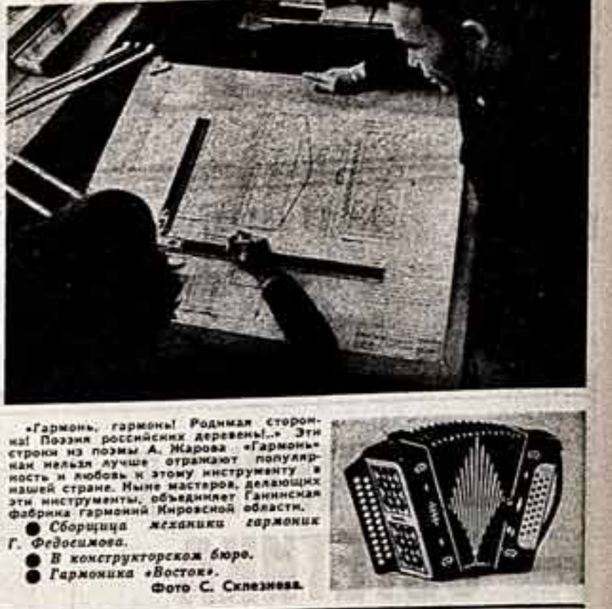
«Гармонь, гармонь! Родная сторона! Позвня родными деревнями...» Эти слова несли в сердцах отголоски популярной песни. Иные мастера, делавшие эти инструменты, объединены в Гангисскую фабрику гармоний Кировской области.