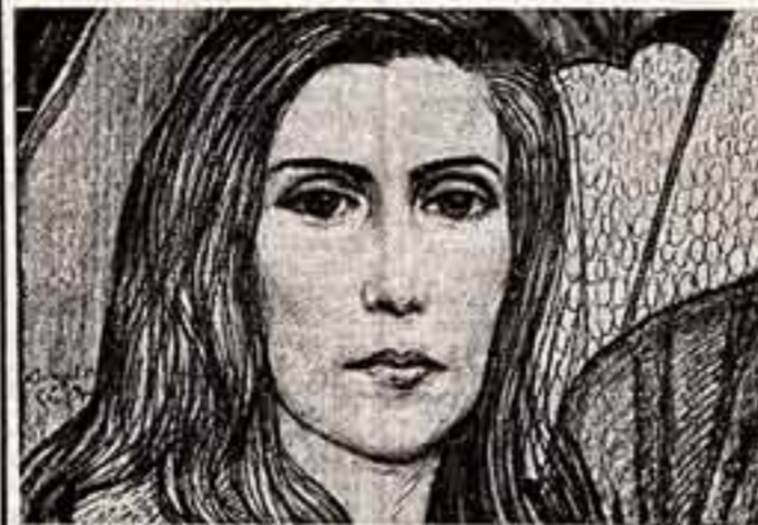
Генеральный секретарь Союза коммунистической молодежи Чили Гладис Мария.