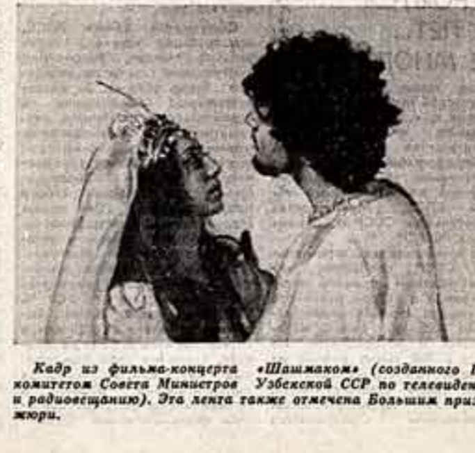
Кадр из фильма-концерта «Шашмаком» (созданного Госкомитетом Совета Министров Узбекской ССР по телевидению и радиовещанию). Эта лента также отмечена Большим призом жюри.