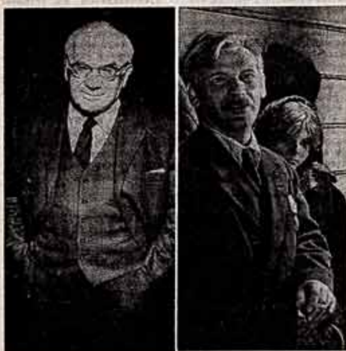
● Игорь Владимирович Ильинский, герой телефильма «Эти разные, разные лица» (Горьковский телевидение), обладатель приза «За мастерство актерского перевоплощения».