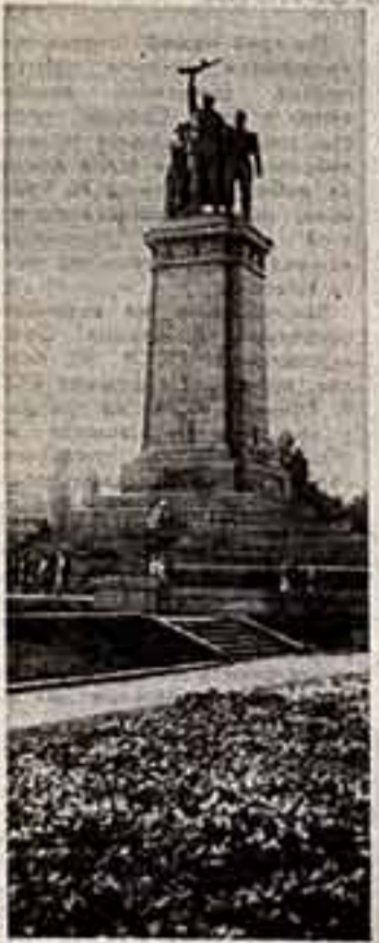
В бронзе и граните обесмертили славы модели советского народа болгарские скульпторы и архитекторы...

Болгария готовится отметить одну из самых знаменательных дат своей истории. Пятдесят лет назад, 23 сентября 1923 года под руководством Болгарской коммунистической партии в стране началось антифашистское вооруженное восстание рабочих и крестьян.