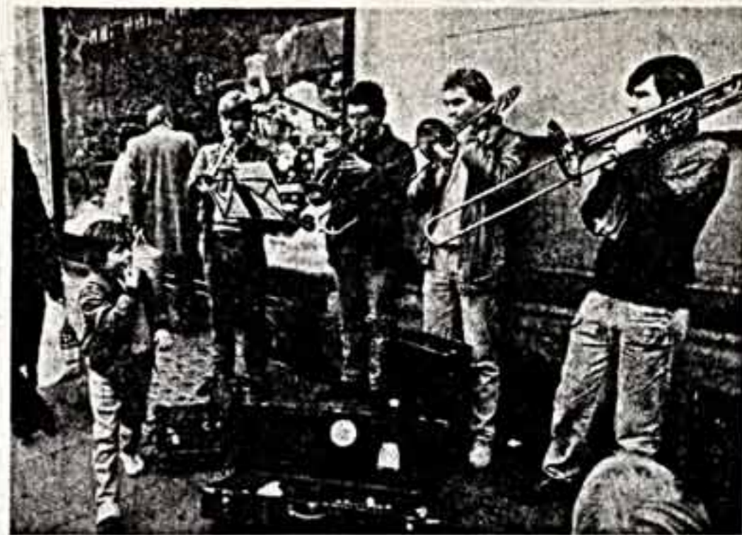
Не любовь и музыка заставила выйти этих юношей, возможно, талантливых, на улицы английской столицы. Они, как многие десятки тысяч молодых жителей Британии, остались без работы и надежд ее получить...