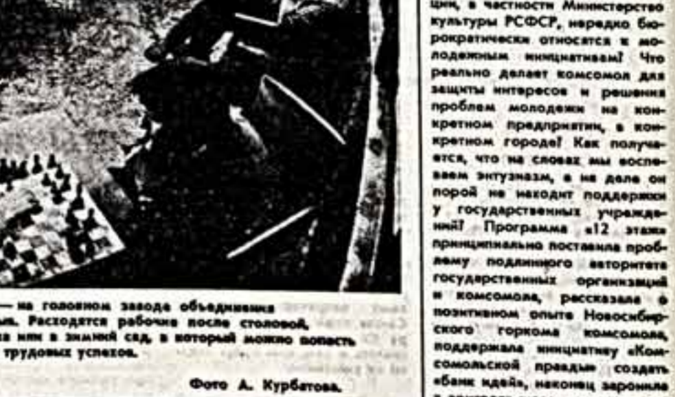
В цехах горит только дежурный свет — на головном заводе объединения «Мосрестроймаш» обеданный персонал. Расседает рабочий после столовой, кто в библиотеку, кто в комнаты отдыха или в знаменитый сад, в который можно попасть прямо из цеха. Хороший отдых — залог трудовых успехов.

Прозанк написал пьесу, и в ней, опубликованной в первой книге журнала «Атмосфера», можно рассмотреть в развитии драматургическую редакцию Центральной ТВ. За этой информационной строкой — сюжет, пожалуй, что соперничающий по остроте и с собственным сюжетом можжевельной пьесы.