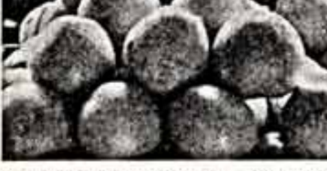
Цены в сцене.

В Баку ежегодно сносятся десятки старых зданий, и не из них образуются горы строительного материала.