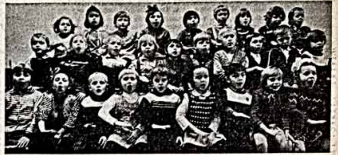
Более тридцати любительских кружков и студий работают во дворе культуры «Фархад» узбекского города Наманган. Самы из них завоевали звание народных. Очень популярны занятия в школе искусств. Для молодежи во дворе действуют ансамбль балетный и современный танца. Те, кто постарше, могут посетить занятия в хоре народной песни.