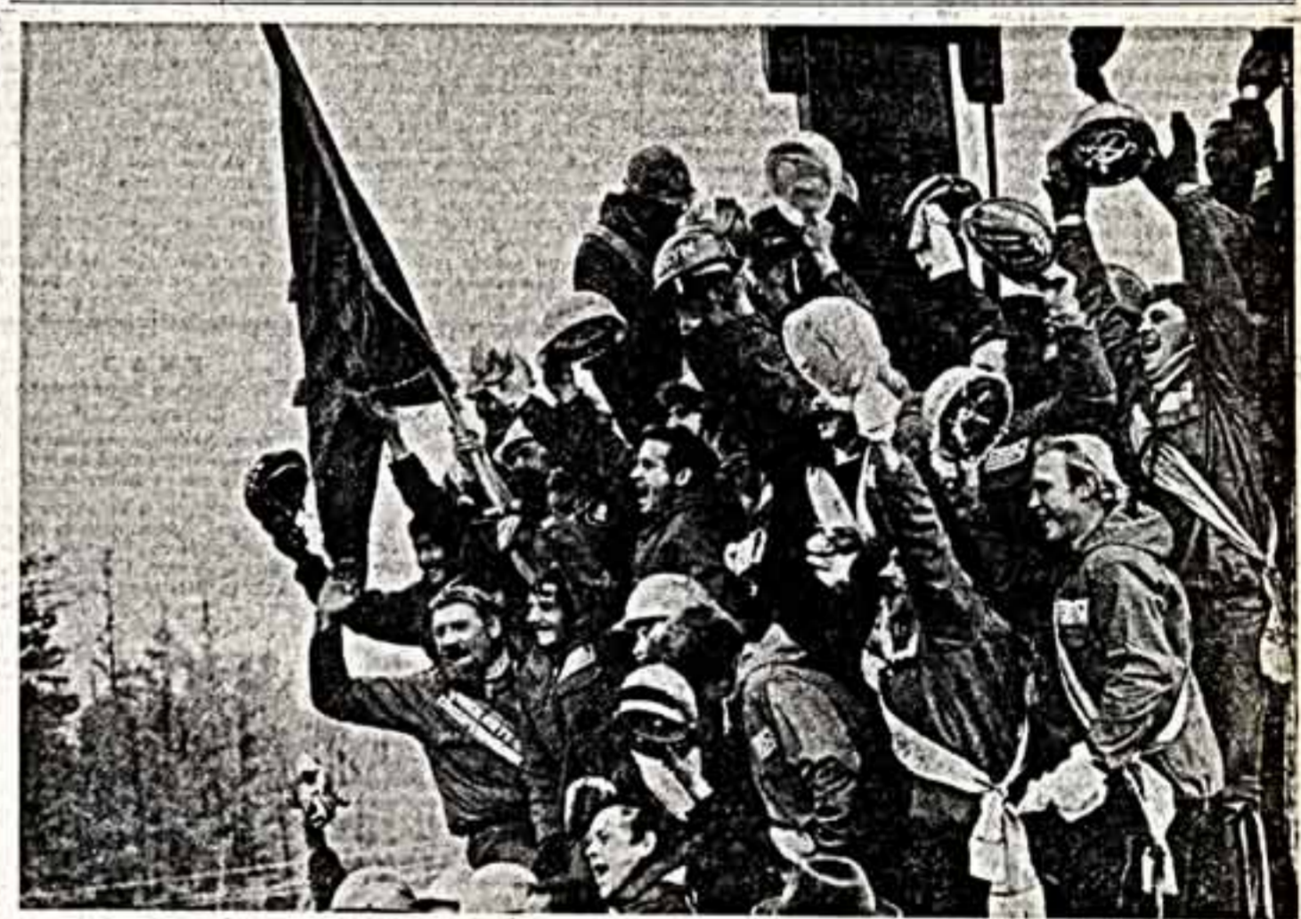
«Рубежи создания» — так называется Всесоюзная фотовыставка, которая открывается завтра в Москве.

В эти дни в области проходит День молодежи Узбекистана. В составе представительной делегации — ветераны партии и комсомола, писатели, артисты, художники. Гости подготовили специальные программы «Советский Узбекистан», «Пою новостное», с которыми выступят перед трудовыми коллективами, а также своими земляками, работающими на ударных комсомольских стройках. В областной выставочном зале Тюмени демонстрируются работы молодых художников южной республики.