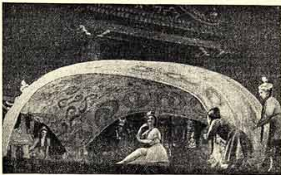
Одесский государственный театр оперы и балета поставил балет «Али-батыр» татарского композитора Ф. Яруллина.