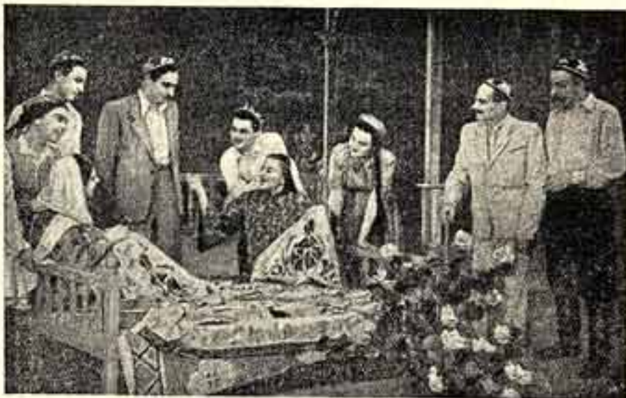
На сцене Художественного театра Латвийской ССР идет пьеса узбекского драматурга Абдуллы Каххара «Шелковое сияние».