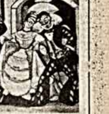
Меня всю жизнь больше всего интересовали русские художники. Пополняя свою коллекцию, я накапливал воспоминания...