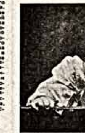
(По сообщениюм корреспондентов «Культуры» и ИТАР-ТАСС).

Взрыв негодования у публики вызвало последнее приобретение Национальной галереи Канады — полотно известного американского абстракциониста Марта Ротко, которое носит неприглядное название «Юнона 16». На картине размером 3X2,5 метра изображен квадрат бежевого цвета в красной рамке. За этот шедевр галерея выложила 1,8 миллиона долларов.