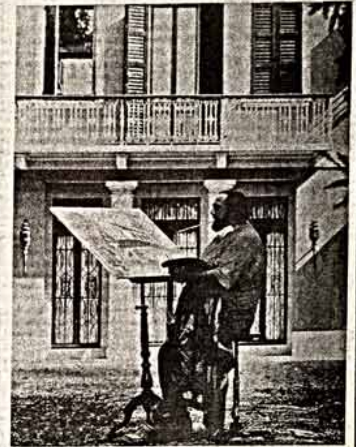
— Нет, а почему? Самая важная вещь для меня — свобода. В моем понимании это возможность работать...