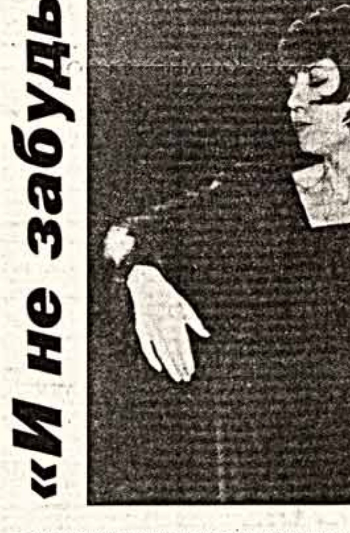
«И не забудь»

Итак — каждый раз! Она не ждалась в бой, в старый репертуар упорно ставила куски из новой, выстраданной, выстроенной программы — раз уж целиком нельзя... Как стойкий андерсенский солдатик, молчала, но не сгибалась. И не ссорилась.