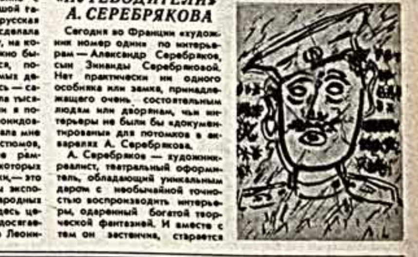
Такая же картина, стараясь