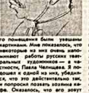
го помещения были увешаны картинами. Мне показало, что некоторые из них очень напоминают работы русских театральных художников...