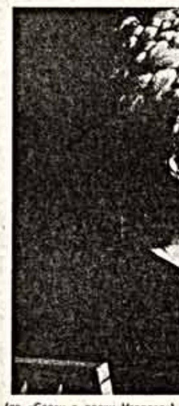
(по «Слову о полку Игореве») и многочасовое представление «Сон — Вест — Радость»...