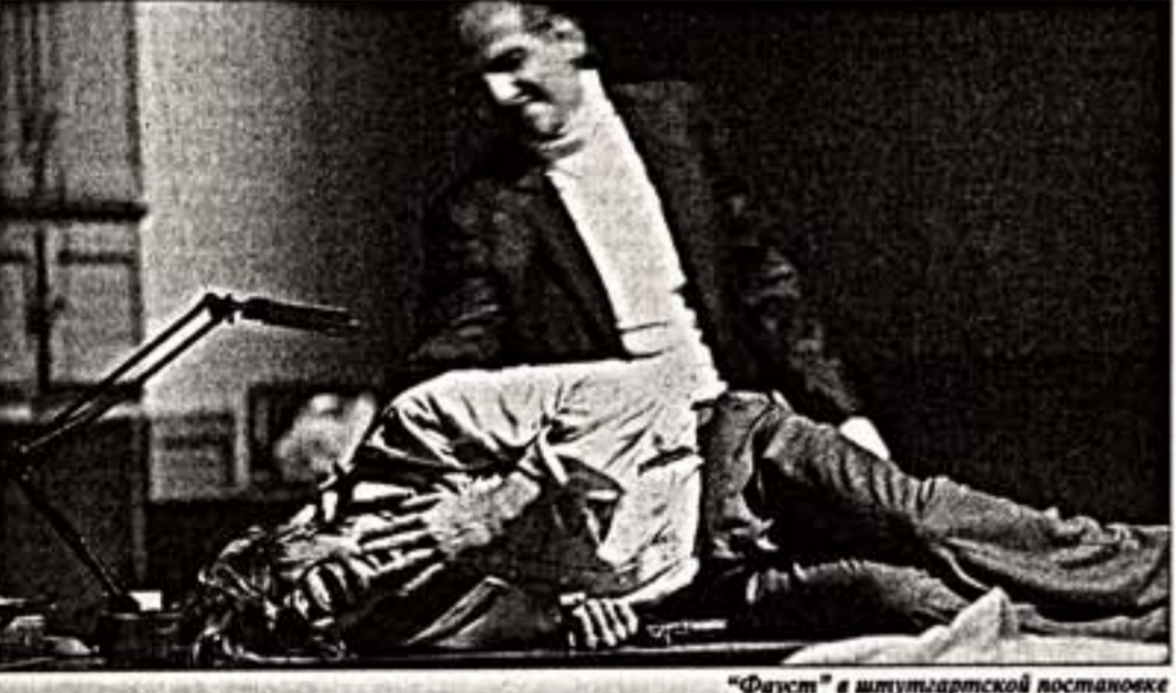
"Фауст" в штутгартской постановке