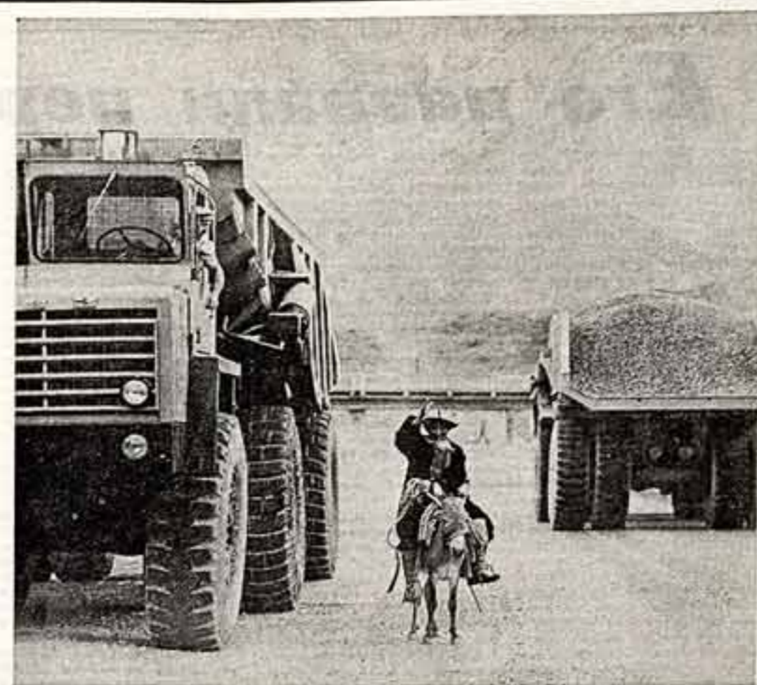
ФОТОКОНКУРС В. САДЧИКОВ. «На дороге XX века».

С. РАЗГОНОВ. ● Пушкин. Счастье войны. ● Павловск. Возрождение дворца. Фото В. Самойлова.