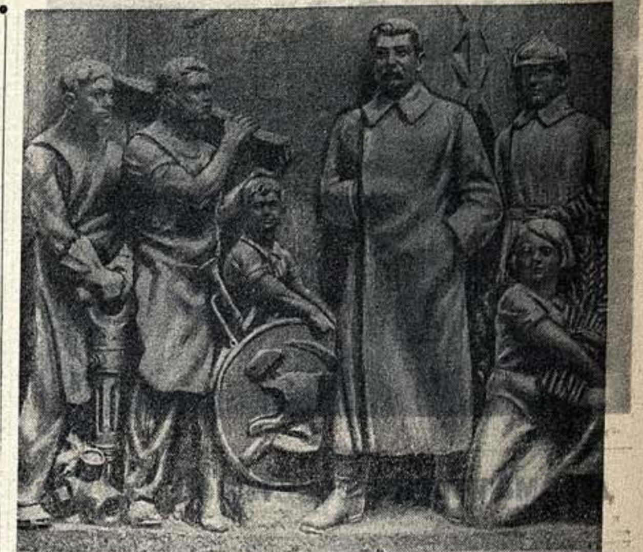
Фрагмент барельефа работы народного скульптора Грузии Я. И. Николадзе на строящемся в Тифлисе здании Института Маркса — Энгельса — Ленина

Председатель Совета Народных Комиссаров Союза ССР В. МОЛотов Секретарь Центрального Комитета ВКП(б) И. СТАЛИН