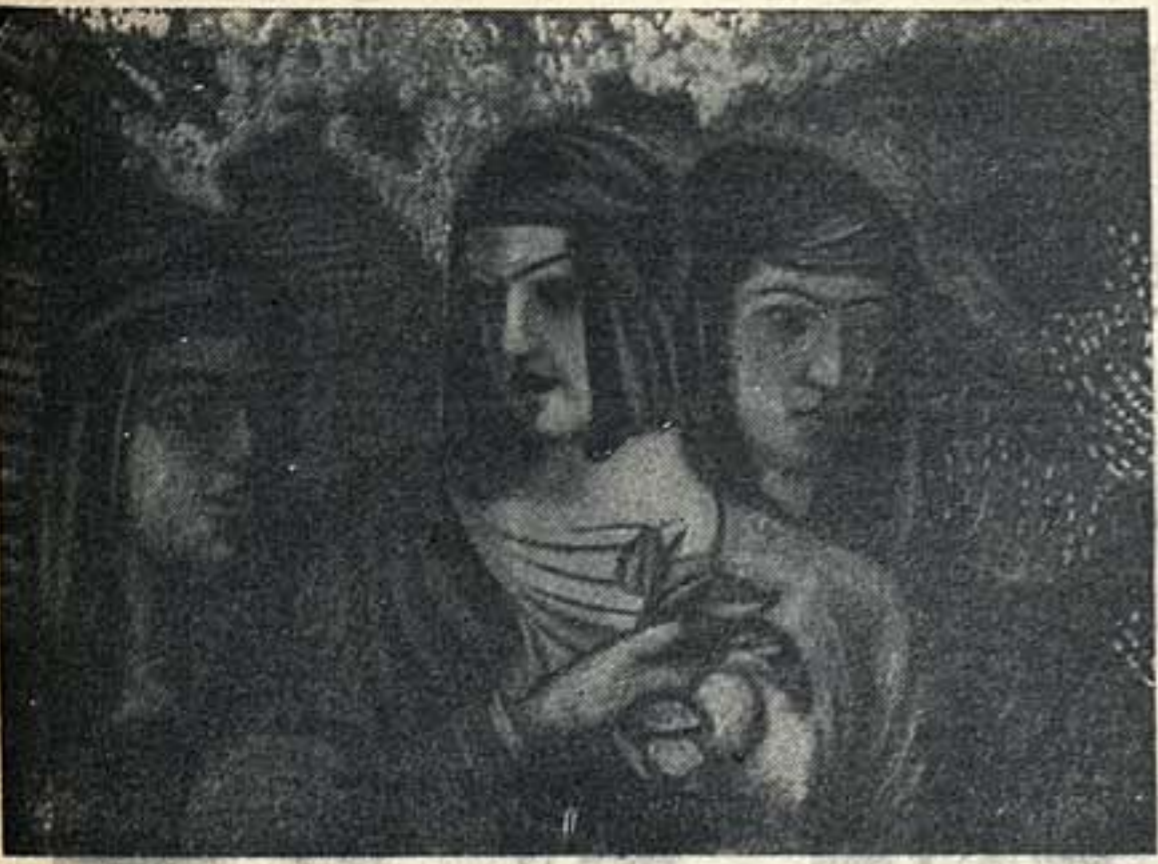
«Гурия одна чару»

Особое место отводится на двух пластинках на пластинках Грузии грузинской музыке. Среди них — «Песни и танцы Грузии» и «Грузинская музыка».