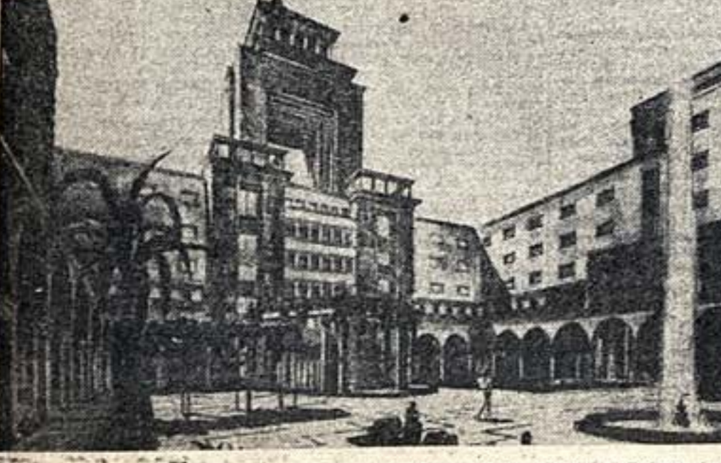
Здание правительства Грузии; строится по проекту профессора С. Д. Капорина в Тифлисе (проспект Руставели)

Счастие выковал рожаем, дал нам новое рожденье, Сталин — символ нашей жизни, Сталин — жизни пробуждения.