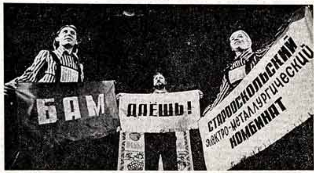
Славится своей агитбригадой Борисовский районный дом культуры в Белгородской области. Агитбригада «Голос времени» — частый гость труженников села, ее выступления тепло встречают на полях и фермах района.