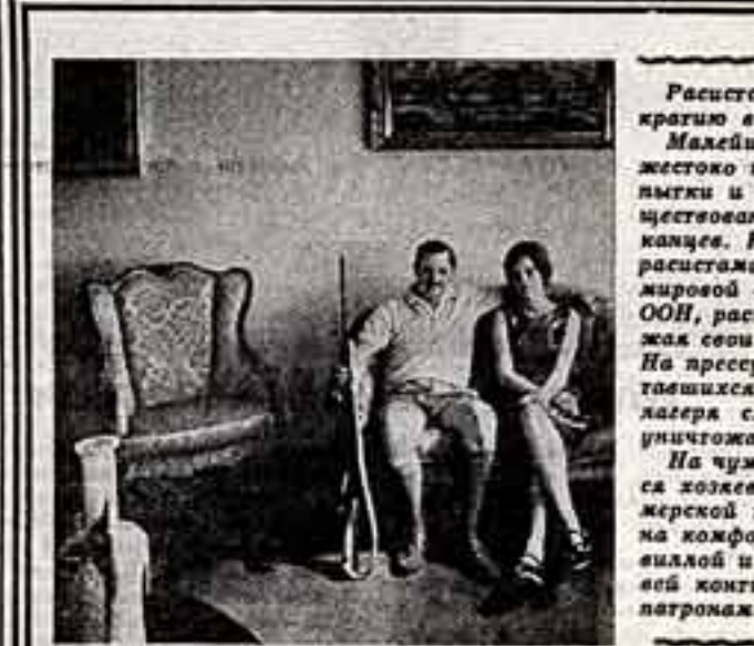
Корреспондент американского агентства Ассошиэйтед Пресс передал на днях из Солсбери изложившие заметки в газете «Родения геральд». Речь в ней шла об «очередной акции террористов» (так на своем жаргоне именуют расисты участников национально-освободительного движения народа Зимбабве), которые якобы зверски убили 4 белых, находившихся на ферме в 50 милях к юго-западу от Солсбери. Сюжет, как видно, для официальной пропаганды режима Смита, не новый.

То, что в США можно превратить в товар буквально все, давно уже не новость для среднего американца. Но известно о том, что даже наша Галактика, как выяснилось совсем недавно, имеет товарную стоимость, можно удивить хоть кого. Благодаря услугам дорогостоящих мажоран из фирмы «Юнайтед планет коминг» (Доклад «Объединенная планетная комиссия») в городе Ван-Нусс (штат Калифорния) за небольшую плату (всего лишь около 4 долларов) можно приобрести участок на Солнце, Венере или где-нибудь на Млечном пути. Зачем! Ну хотя бы для того, чтобы построить там особняк, да еще и с гаражом.