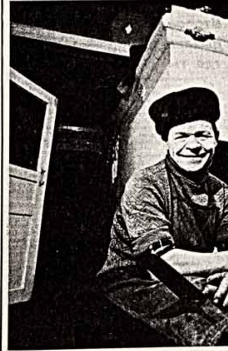
Василий Осипович Топорков был не только одним из талантливейших учеников Станиславского, но и одним из тех, кто не только воспринял уроки Мастера, но и продолжил творческую преемственность и пропагандировать их на протяжении всей жизни. Топорков остался в истории нашего театра не только как блистательный актер. Он был доктором искусствоведения, его перу принадлежат многочисленные книги и статьи о театральном искусстве, секретарь актерской профессии. Его книга «Станиславский на репетиции» выдержала несколько изданий и нас в стране, была переведена на многие языки мира. Двадцать с лишним лет Топорков отдал преподаванию в Школе-студии МХАТа, заводил там кафедру актерского мастерства. Несколько успешной была его работа на этом поприще — судите сами: среди его учеников были Олег Ефремов, Валентин Гафт, Евгений Урбанский, Олег Табаков... Василий Осипович Топорков за свою долгую творческую жизнь сумел сделать для отечественного театра очень много. Таланты такого рода остаются в памяти надолго — это драгоценные находки в сокровищнице нашего искусства. Поэтому, вспоминая этого замечательного актера и блестящего человека, след за Юзовским хочется закончить восклицанием: «Взгляните на Топоркова. На Топоркова!»

ВЕЧЕРНИЙ ЧАЙ. 15 марта 1989 года выпускается в обращение памятная монета достоинством 1 рубль в связи со 150-летием со дня рождения М. П. Мусоргского — русского композитора. Ее тираж — 3 млн. штук, в том числе 0,3 млн. штук утилитарного качества. Наряду с находящимися в обращении в настоящее время монетами указанная монета обязательна к приему государственными, кооперативными, общественными предприятиями, учреждениями, организациями, колхозами и отдельными лицами во все виды платежей, а также учреждениями банков СССР и предприятиями министерств связи для зачисления на текущие, расчетные счета, во вклады, на аккредитивы и для перевода без всяких ограничений. В. БУРБУЛИС. (Наш соб. корр.) ВИЛЬНЮС.