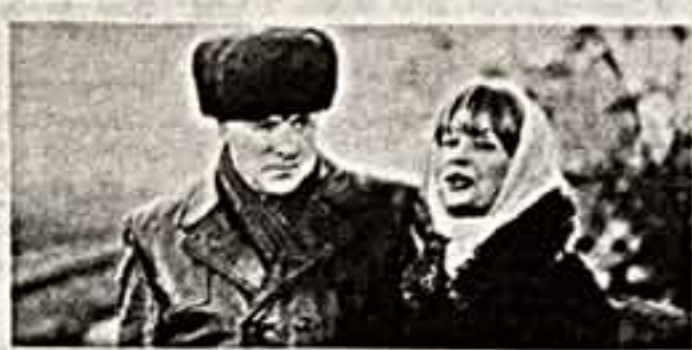
— 1 пр., 21.58. Из фондов ЦТ вашему вниманию предлагается телевизионный художественный фильм «Транзит»...