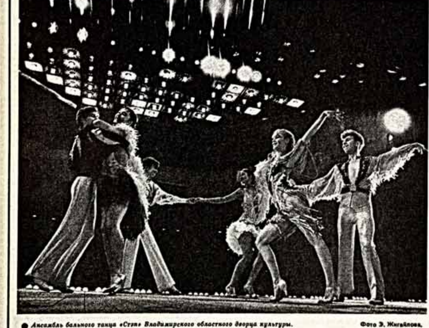
Ансамбль балетного труппы «Стя» Владимирского областного дворца культуры.