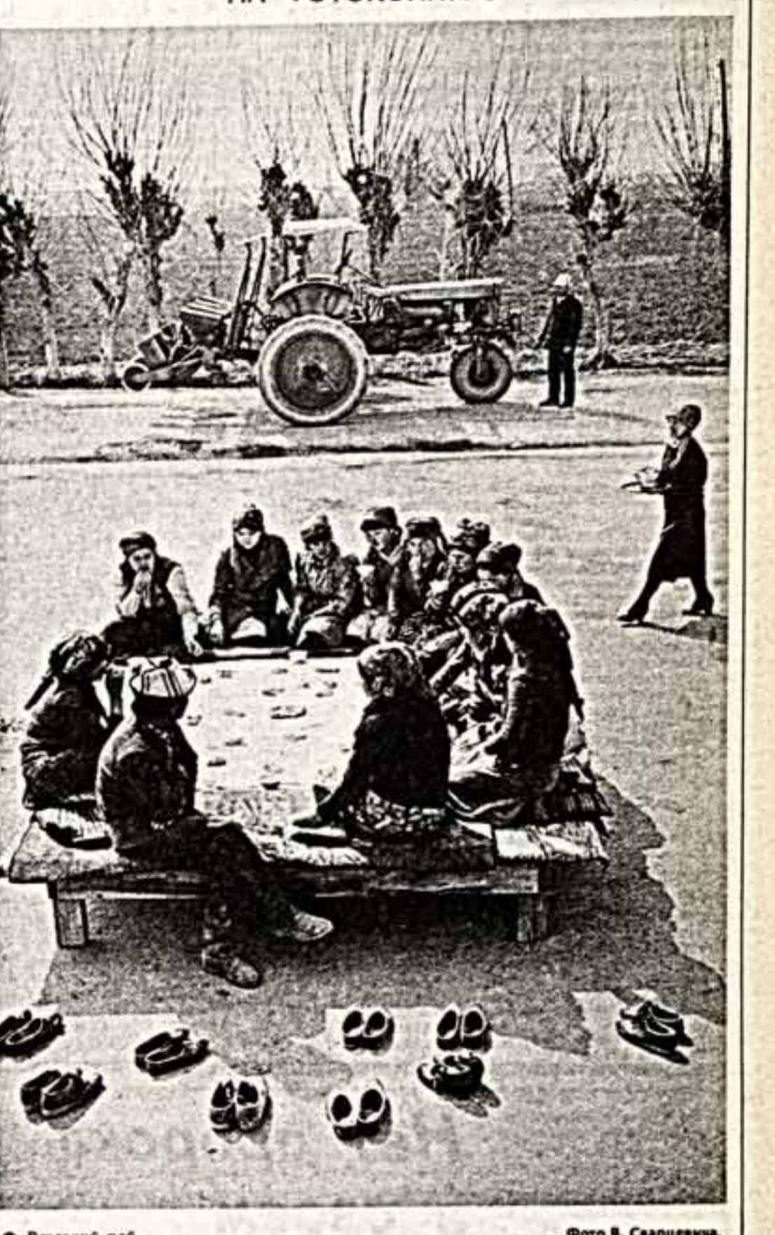
Вечерний чай.