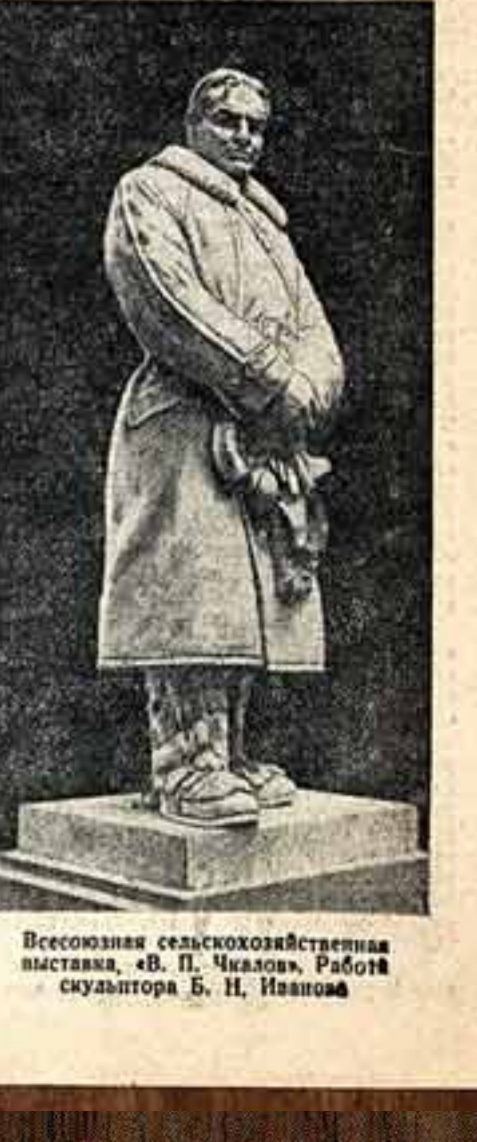
Всесоюзная сельскохозяйственная выставка. «В. П. Чалов». Работа скульптора Б. И. Иванова.