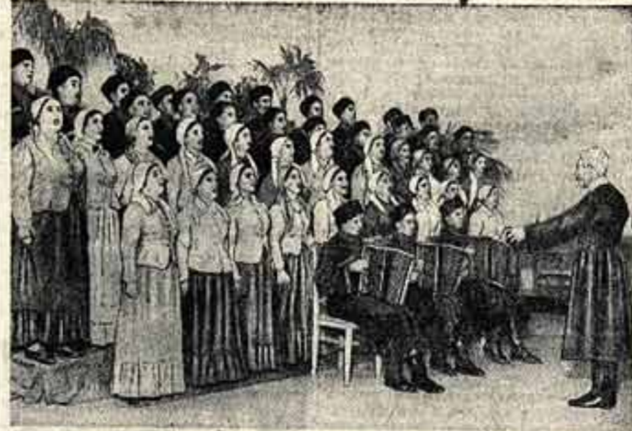
16 августа в Москве начался показ ансамбля песни и пляски РСФСР. На снимке: выступление ансамбля песни и пляски кубанских казаков на концертной эстраде Центрального парка культуры и отдыха им. Горького