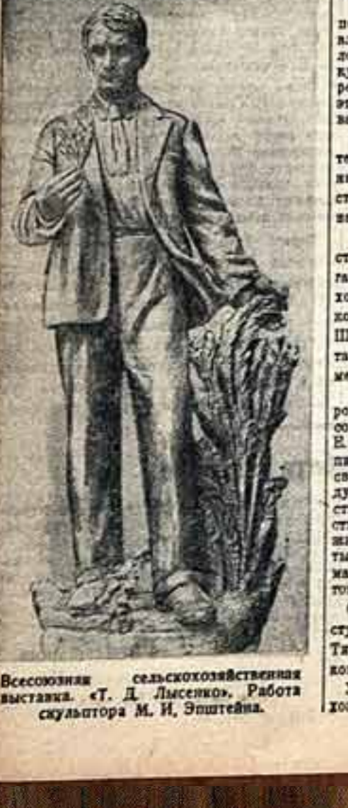
Всесоюзная сельскохозяйственная выставка. «Т. Д. Лисенко». Работа скульптора М. И. Эшштейна.