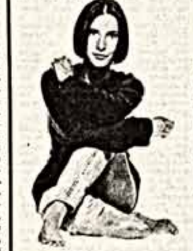
«ЛЕД И ПЛАМЯ»

Антону в образе немолодого буддийского монаха тоже не удалось избежать критики. Он выдает полуобритую голову себе на голову, а оставшиеся — за шиворот.