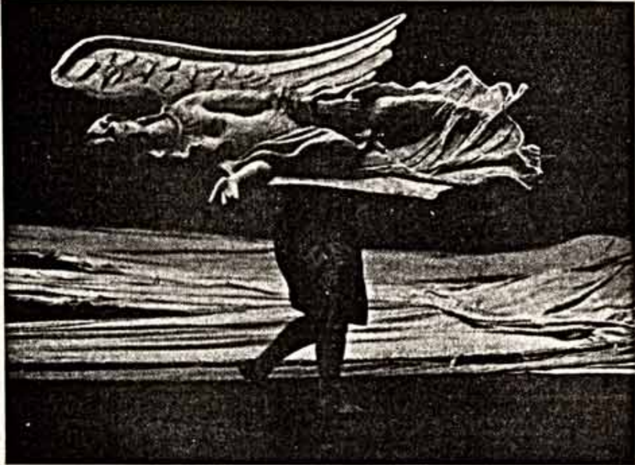
За кулисами Большого театра