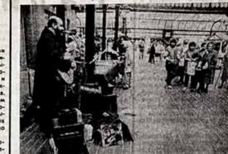
Интерес К литературе