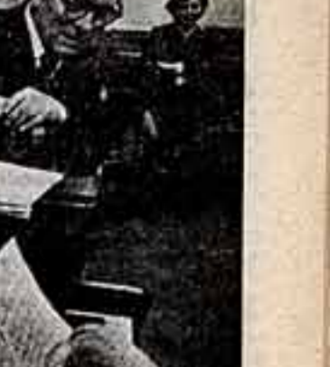
Участники и гости фестиваля будут иметь возможность не только ознакомиться с достижениями республик, недавно отмечающих 60-летие и 40-летие Коммунистической партии Молдавии. Предусмотрены поездки в города и районы, встречи с рабочей, сельской, творческой и студенческой молодежью.

Мы рассчитываем, что конкурсные программы станут предметом обсуждения на нашем совещании по актуальным проблемам молодежного вещания, которое будет проведено в рамках фестиваля. Как известно, фестивали молодежных телевизионных программ и телефильмов проводятся Гостелерадио СССР совместно с ЦК ВЛКСМ. Они стали уже традиционными. До этого фестивали проходили в Кieve, Кишиневе, Горьком, Алматы, Волгограде. И вот на очереди VI фестиваль, который собираемся в гостеприимной столице Советской Молдавии — городе Кишиневе.