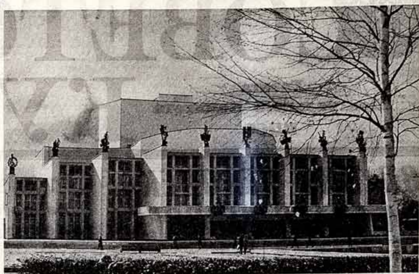
Ижевск. В культурной жизни Удмуртской АССР произошло заметное событие: справил новоселье республиканский музыкальный театр. В новом здании — зрительный зал на 900 мест, хорошая сцено- и звукотехника, удобные комнаты для режиссера, уютное фойе.