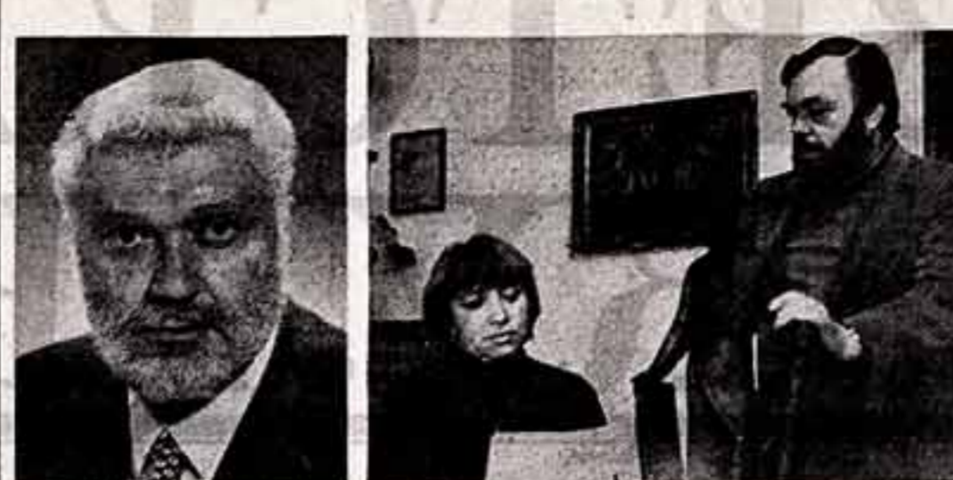
АБРАМОВ Х. Б., народный артист СССР. КОМОВА И. Н., архитектор, и КОМОВ О. К., народный художник РСФСР. ГРОМОВ А. К., оператор.