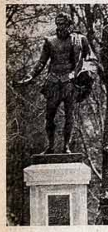
Молодость Старого Парка