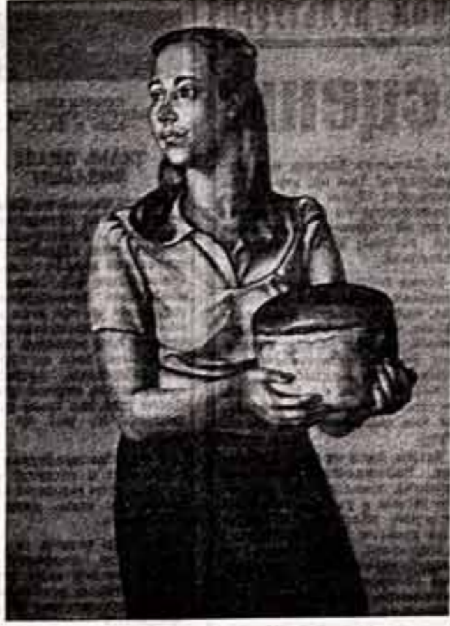
А. МИГОВ. (Москва). «Первый ревком Чукокка». Ф. БАРАНОВ. (Кубинское). «Сотников». Н. КРЫШЕВ. (Орбурге). «Девушка-а-паровозик».