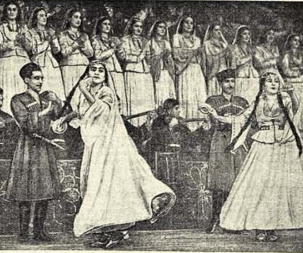
Декада азербайджанской литературы и искусства в Москве. Выступление Азербайджанского государственного ансамбля песни и пляски в Колонном зале Дома союзов.

Советская кинематография имеет уже значительный опыт создания замечательных фильмов, отражающих строительство в годы предвоенных сталинских пятилеток — «Туркмен», «Днепрогос», «Есть метро!», «Москва—Волга» и другие. К пуску гидроэлектростанции должны быть созданы и полнометражные цветные фильмы, посвященные великим стройкам коммунизма. Мы обязаны отобразить все важнейшие этапы строительства, установить тесную связь с проектами организационными и руководящими работниками, чтобы не пропустить ни одного важного события в процессе этих грандиозных работ. Операторы должны уже сейчас запечатлеть на пленке места, где разрабатывается строительство. При этом важно акцентировать не только места строек, но и огромные пространства вокруг них. Этим мы откроем первую страницу кинолетописи. Съемки необходимо проводить не только на черно-белой пленке, но и на цветной, имея в виду, что в дальнейшем они будут использоваться для цветных фильмов. Создавать кинопроизведения в великих стройках сталинской эпохи — дело чести советских кинематографов.