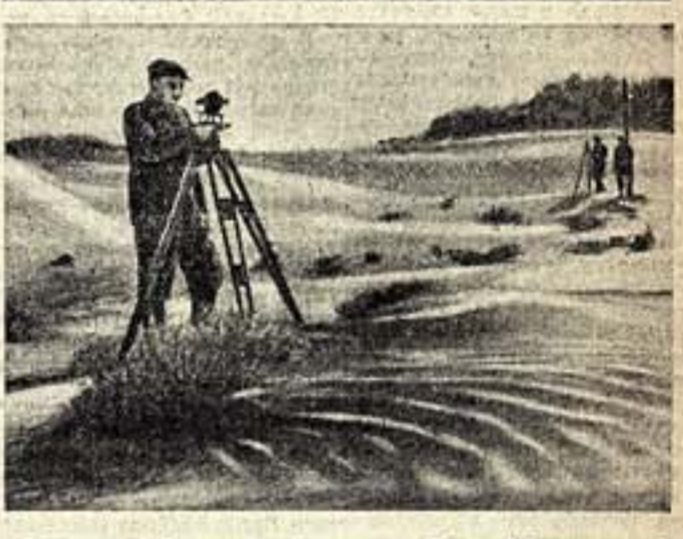
Куйбышев и Сталинград, Туркмени и Каховка! Великие стройки коммунизма! Весь советский народ участвует в гигантских работах по сооружению мощных гидроэлектростанций и каналов. И с первых дней строительства вместе с первыми исследователями и топографами на трассе работы работников советской документальной кинематографии. Они призваны запечатлеть на пленке все этапы строительства, создать кинолетопись великих сталинских строек.

На Центральную студию документальных фильмов поступают из разных уголков страны возмущение кадры, отображающие начало великих преобразований.