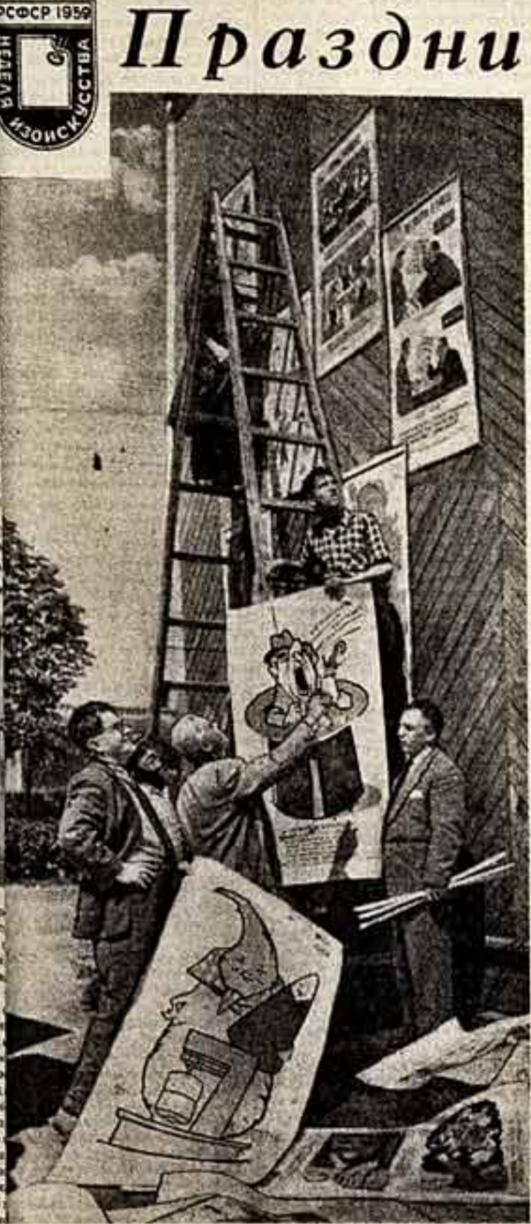
МАССОВОЙ пропаганды творчества советских живописцев, графиков, скульпторов, плакатистов, художников-прикладников, ярким показом их достижений будет отмечена неделя изобразительного искусства Российской Федерации.

Это далеко не все черты, характеризующие творчество Театра имени Руставели. Можно ли сейчас, в наши дни, не развивать эти качества в новом, молодом поколении нашего театра? Но, повторю, для того чтобы сохранить эти дороги театру традиции, нужна драматургия художественных произведений, отобразивших действительность, метод, обеспечивающий театру возможность показать своей неповторимой творческой почерк, стиль, манеру, свою индивидуальность. Социалистический реализм — это верный путь для полнейших творческих поисков и находок. Обидно, что часто вместо новаторских смелых, ярких, дерзких спектаклей мы являемся свидетелями серых, скучных, безликих специализированных. Печальнее всего то, что эти спектакли, за редким исключением, хотя и поставлены разными театрами, часто до смешного похожи один на другой.