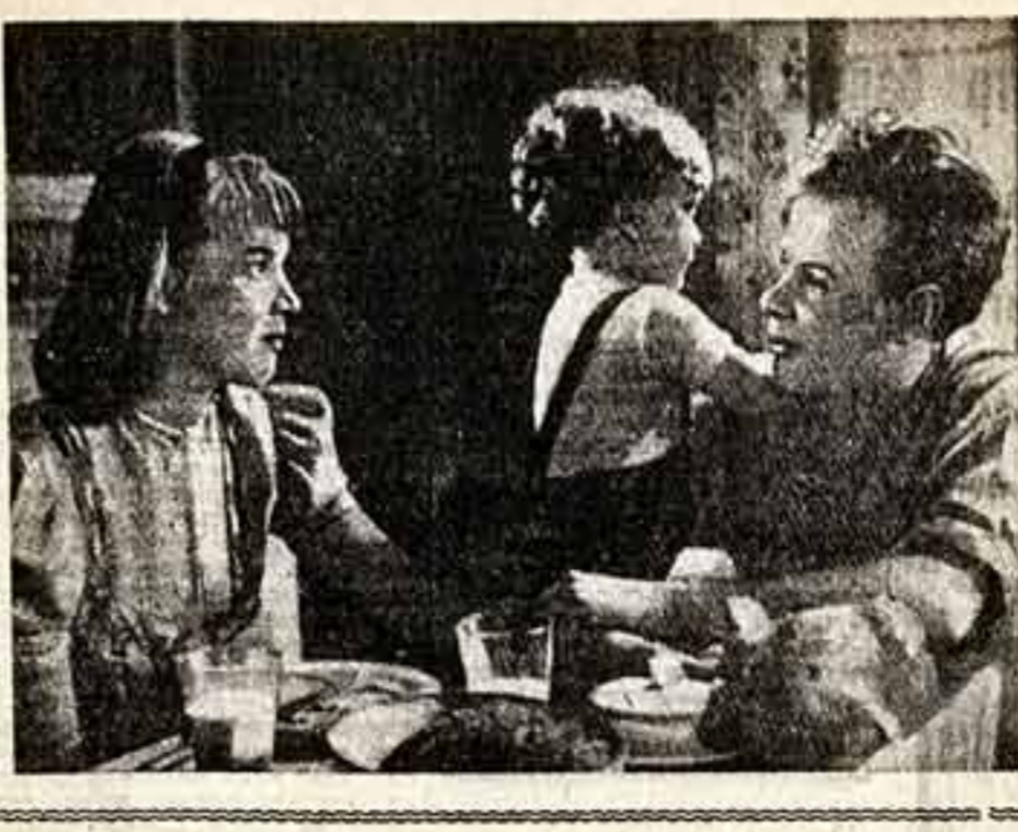
Замечки по поводу...

Постановка пьесы осуществлена заслуженным артистом РСФСР Г. Конякиным и Ю. Неллиным, художником С. Салом.