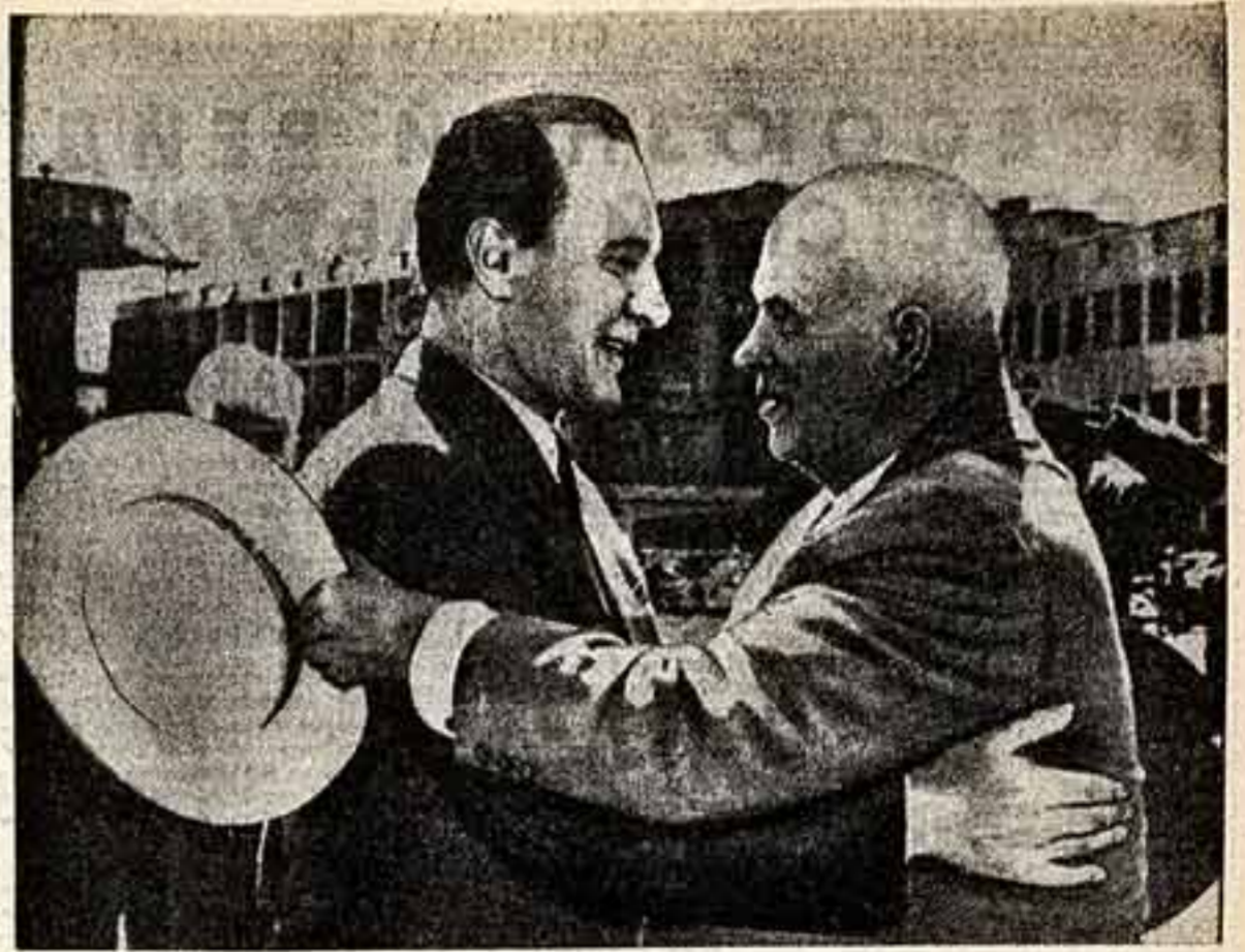
Приветствие в Будапеште Первого секретаря ЦК КПСС и Председателя Совета Министров СССР товарища Н. С. Хрущева. На снимке: первый секретарь ЦК Венгерской социалистической рабочей партии Янош Кадар приветствует на аэродроме Н. С. Хрущева. (Снимок принят по фототелеграфу).