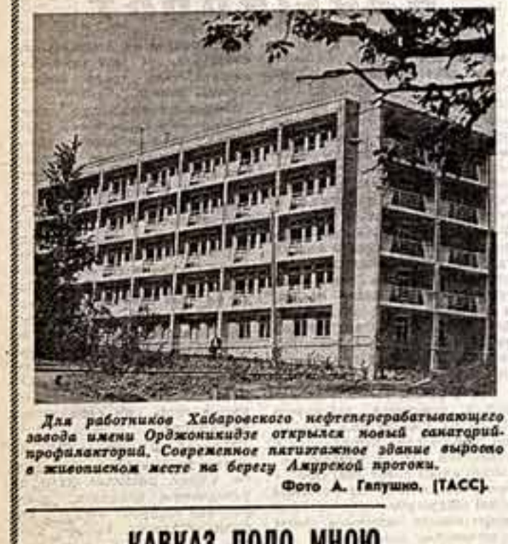
Для работников Хабаровского нефтеперерабатывающего завода имени Ордена Красного Знамени открылся новый санаторий-профилакторий в Союзном поселке на берегу Амурской протоки.

На курорте солнечной Армении пришла зима. Сезон открылся высокогорными здравницами Цахкадзор и Бюракан.