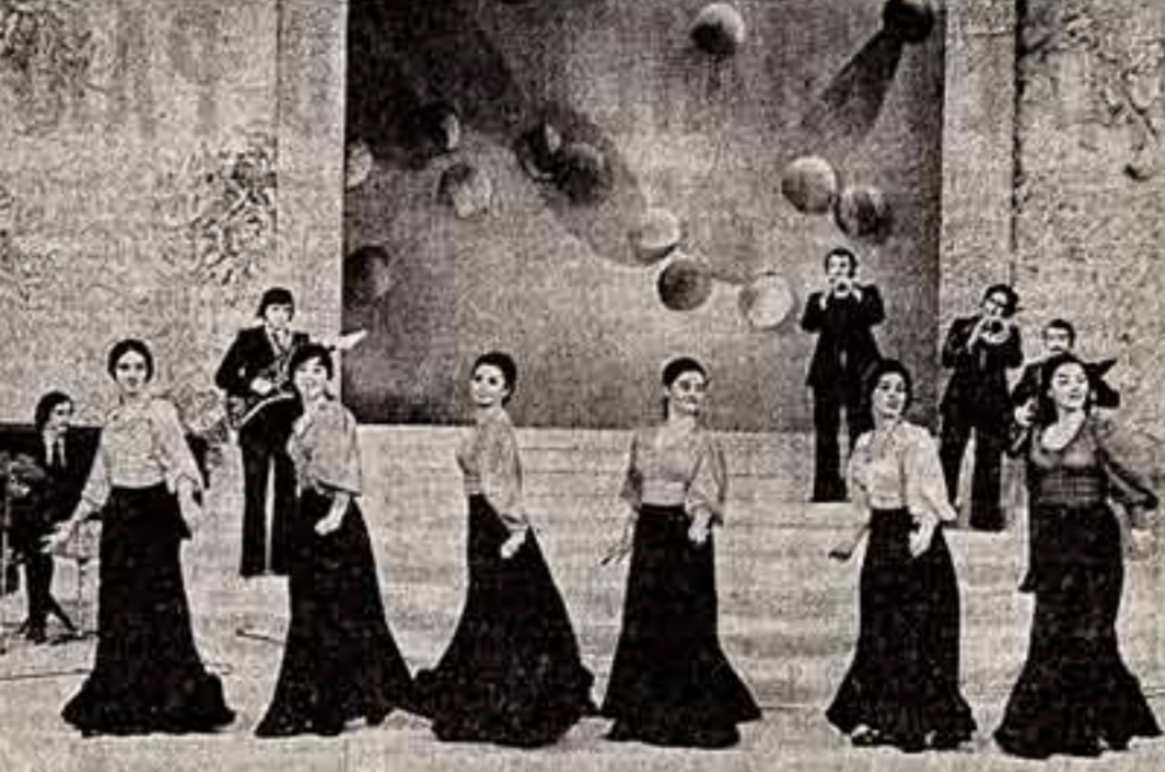
На очередную встречу приглашены зрители «Артлото». В этой передаче, которую готовят Главная редакция музыкальных программ Центрального телевидения, примут участие популярные певцы и поэты, танцевальный дуэт и коллектив исполнителей.